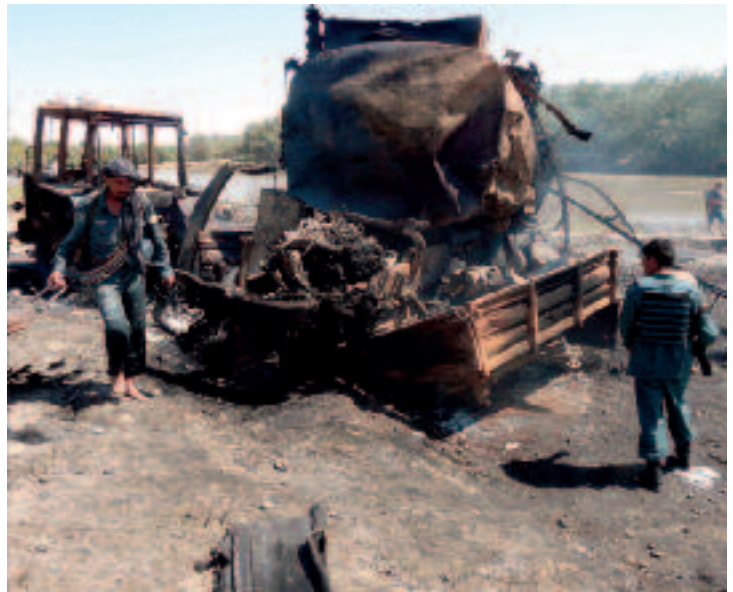
Volgens de aanklager kon de Duitse commandant niet voorzien dat er bij de luchtaanval burgerslachtoffers zouden vallen

dende partijen: zowel voor het Afghaanse leger en ISAF als voor de opstandelingen. De Generalbundesanwalt laat in het midden of dit NIGC ook als ‘burgeroorlog’ in de zin van de strenge eisen van het Tweede Aanvullend Protocol II bij de Geneefse Conventies (AP II) kan worden aangemerkt. Hoe dit ook zij, de aanduiding als