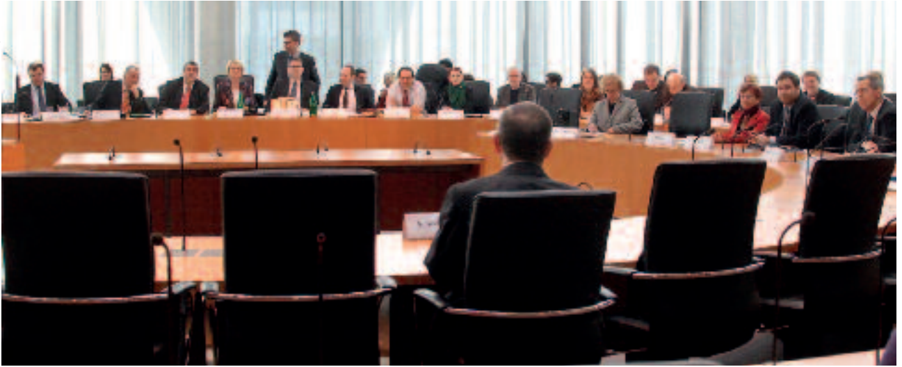
Een onderzoekscommissie van de Bondsdag wil onder meer antwoord op de vraag of het parlement tijdig en juist is geïnformeerd over de luchtaanval

operaties van de opstandelingen. De vernietiging levert bovendien een duidelijk militair voordeel op voor ISAF, omdat de opstandelingen daarvoor deze brandstof en/of trucks kwijtraken. Al met al blijkt dat zowel strijders als de brandstof(trucks) een legitiem militair doel in de zin van het oorlogsrecht vormden. Binnen de overige grenzen van het oorlogsrecht mogen deze dus worden aangevallen. Een aantal van die ‘overige’ regels betreft verboden methoden/wijzen van oorlogvoering. De Generalbundesanwalt toetste de luchtaanval aan twee verboden ‘methoden’ of wijzen van oorlogvoering in de zin van het Völkerstrafgesetzbuch: een gerichte aanval tegen burgers en een disproportionele aanval.