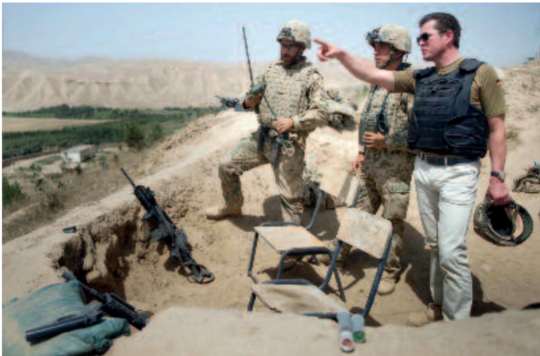
De huidige Duitse minister van Defensie, Karl-Theodor zu Guttenberg (rechts), bezoekt in Kunduz gelegerde militairen van de Bundeswehr, augustus 2010

de aanklager bekend was met andere (en recentere) inlichtingen waardoor de commandant een extra passage van de vliegers niet nodig vond.