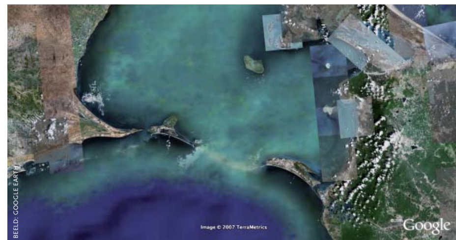
Satellietbeeld van Ramsetu: volgens sommige Hindoe-organisaties een door de god Ram gecreëerde verbinding tussen India en Sri Lanka.

De volgende nationale verkiezingen vinden plaats tussen 16 april en 13 mei 2009, tussen de UPA onder leiderschap van de Congrespartij (gewapend met het lied Jai Ho dat als titelsong van Slumdog Millionaire een Oscar kreeg), de NDA onder leiderschap van het BJP, en een derde front.