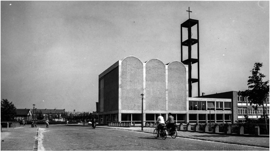
De Hoeksteen gezien vanaf de Henriëtte Roland Holststraat.

beter bekend onder de bijnaam het Maupoleum, aan de Jodenbreestraat (1969, afgebroken in 1994). In 1980 beëindigde hij zijn actieve architectenloopbaan.