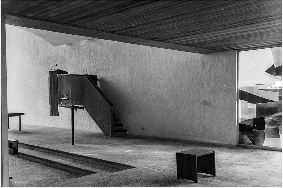
De preekstoel vanuit de avondmaalruimte.

tuur is van bijzondere kunsthistorische waarde. Ze zijn gedeeltelijk opnieuw gemaakt, nadat de oorspronkelijke glaslijm begon los te laten.