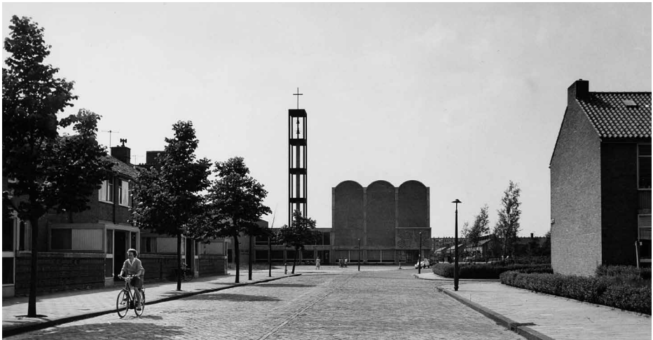
Kerk De Hoeksteen vanaf de Louis Couperusstraat.

ver een opvallend oriëntatiepunt, al staat het van die straat net naast de as. De begin jaren tachtig wegens bouwvalligheid afgebroken toren stond naast de as van de straat, maar domineerde door zijn hoogte de omgeving.