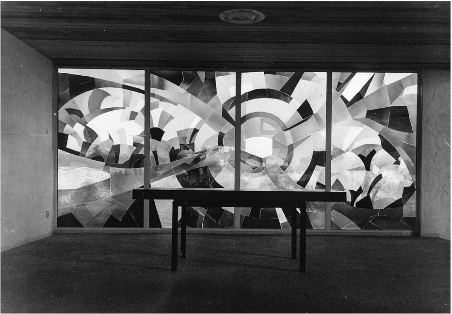
Het glasappliqué aan de kant van de Henriëtte Roland Holststraat.

uitvoerde in de wederopbouwperiode en die in totaal slechts drie kerken realiseerde. Verder kenmerken het interieur en het exterieur van het kerkgebouw zich door een bijzondere eenvoud, terwijl de subtiele omgang met het licht het interieur tot op heden een bijzonder karakter verleent. Ten slotte is de kerk ook een bijzondere representant van de wederopbouwperiode door de bijzondere functie die het gebouw vervulde als sociaal en cultureel centrum voor de wijk, gedacht als integraal onderdeel van een schoolcomplex. Deze waarde blijft ook zonder de aanwezigheid van de scholen behouden.