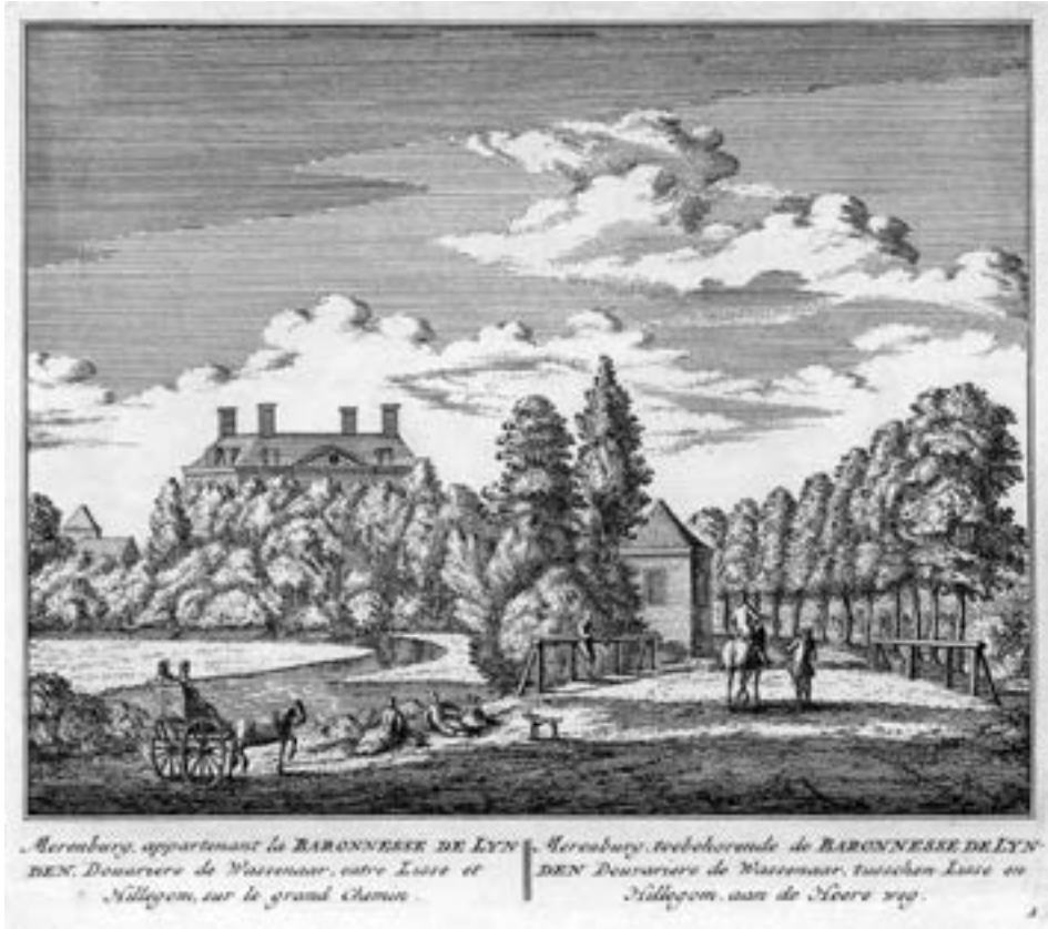
Afb. 1. Merenburg, gelegen aan de Heerweg tussen Lisse en Hillegom (gravure uit: Abraham Rademaker, Rhylands fraaiste gezichten; vertoonende alle deszelfs lustplaatzen, heerenhuizen en dorpen, Amsterdam, 1732, nr. 1)

Holland met een aantal van ongeveer 300 à 430 verreweg de meeste heerlijkheden telde, concurreerden de ongeveer 400 à 500 regenten er met tientallen edelen, met het hof en met de achttien stemhebbende steden om de honderden ambachten en heerlijkheden die in de loop van de zeventiende en achttiende eeuw in verkoop kwamen. 10