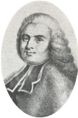
Afbeelding 3. Jacques Barbeu-Dubourg (1709-1799). 5

Barbeu-Dubourg had een oplossing voor dit probleem van saaie, droge en moeilijk te onthouden data bedacht: een soort chronografisch apparaat, waarmee maar liefst ruim 16 meter tijdbalk kon worden afgedraaid. 6 Met behulp van een lineaire voorstelling en – voor die tijd – nieuwe visualisatie van de chronologie van de geschiedenis – in gelijk verdeelde compartimenten van tijd – meende hij een manier te hebben gevonden waarmee men gemakkelijker de chronologie en daarmee de geschiedenis in beeld kon brengen (afb. 4). 7