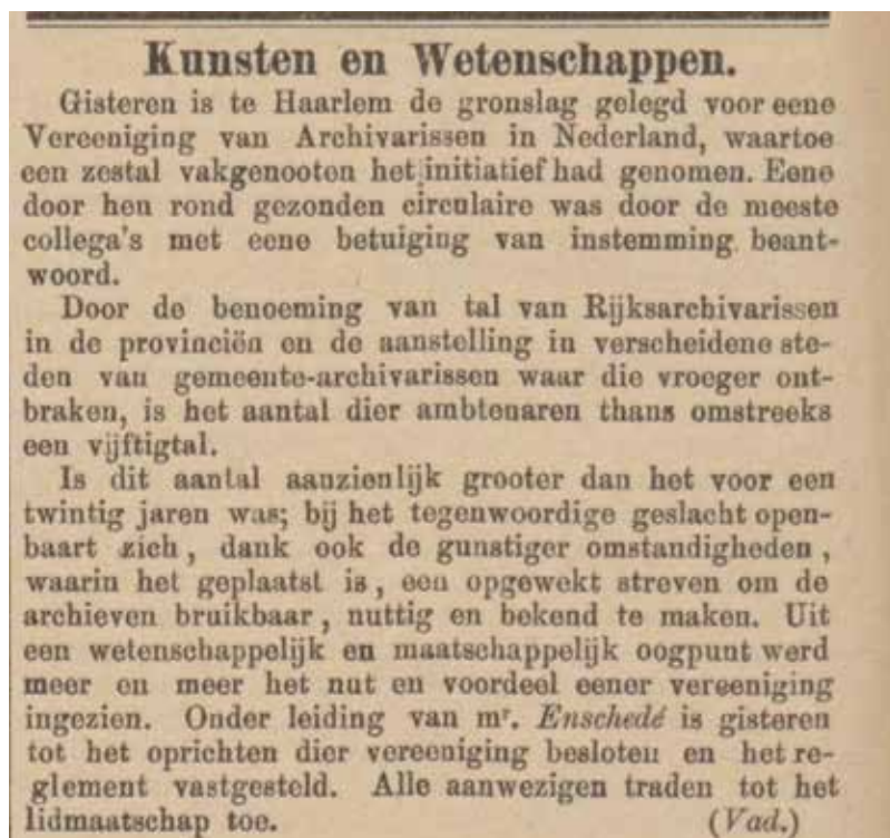
Nieuwsbericht over de oprichting van de Vereeniging van Archivarissen in Nederland.