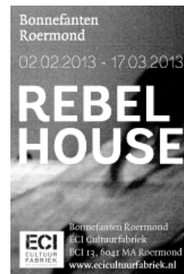
Jonge kunstenaars reageren op oeuvre Atelier van Lieshout

Een ander voorbeeld van de moeizame route op privaatpubliek terrein biedt de presentatie van de nieuwste liefde van het Stedelijk, The Monique Zajfen Collection, samengesteld met geld van The Broere Charitable Foundation. De stichting van de Dordtse rederijfamilie Broere