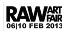
RAW Art Fair, an independent fair with a festival flair