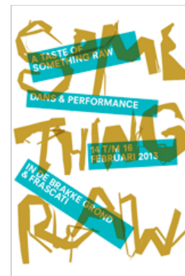
De nieuwste hedendaagse dans & performance