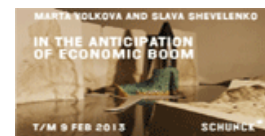
Nog tot en met 9 februari in Schunck

The Vincent Award 2008 Stedelijk Museum, Amsterdam 20 juni t/m 30 september