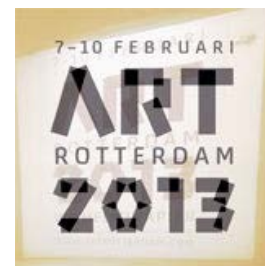
'Cool emerging art in chilly Rotterdam' The Art Newspaper