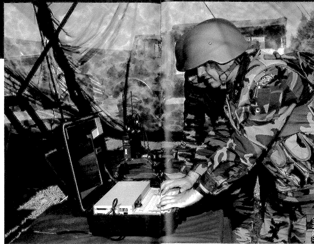
Oefening in Doganbey (Turkije) in 2003 van de NATO Response Force (NRF), een onderdeel van de NAVO dat snel en wereldwijd inzetbaar is. Het bestaat uit land-, lucht-, zee- en speciale strijdkrachten. Het beschikt over 25.000 manschappen die binnen vijf dagen kunnen worden ingezet en minimaal 30 dagen actief kunnen zijn.

De Europese Unie is bij de taakuitbreiding