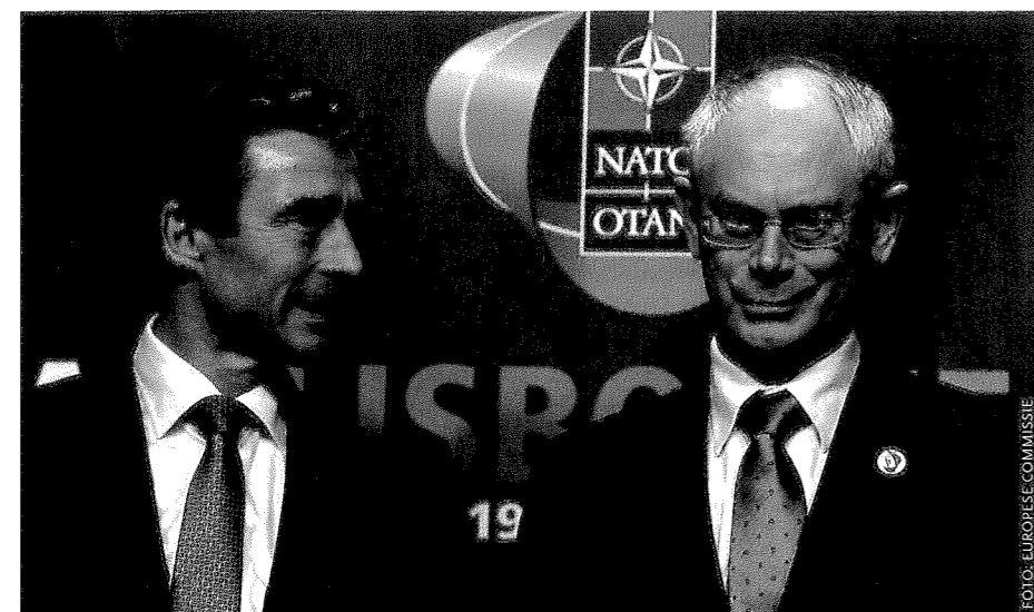
Anders Fogh Rasmussen, secretaris-generaal van de NAVO, en Herman van Rompuy, voorzitter van de Europese Raad, de NAVO-top op 19-20 november 2010 in Lissabon.

Ten tweede is er in Active Engagement, Modern Defence nogal wat aandacht voor ontwapening en wapenbeheersing. Het lijken begrippen uit