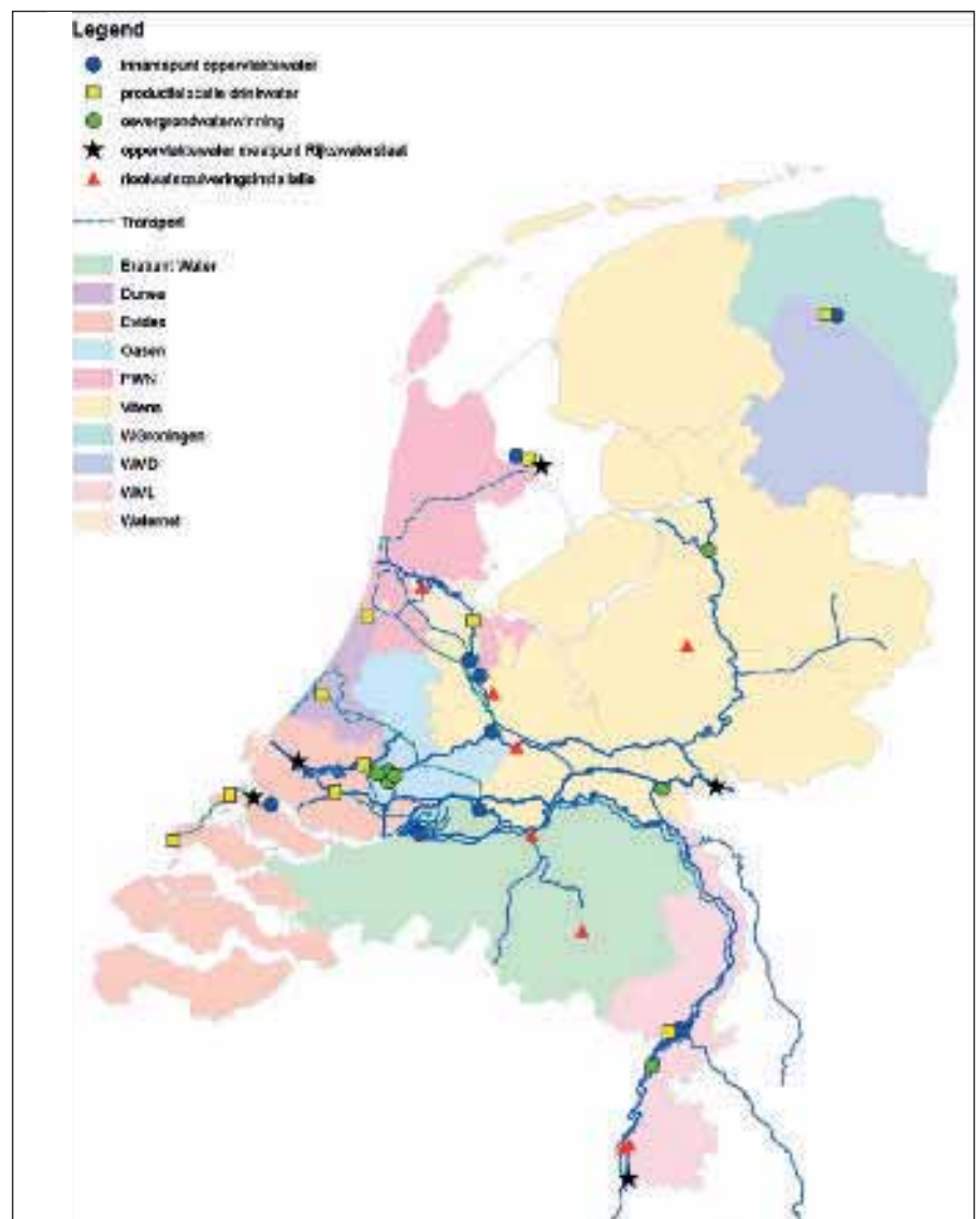
Afb. 1: Overzicht van de meetlocaties.