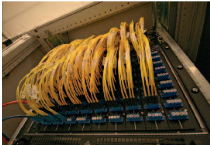
Het cyberdomein is vooralsnog sterk afhankelijk van civiele partijen, waaronder providers

een Siberische oliepijpleiding in 1982: de door Rusland (in Canada) gestolen software zou door de CIA zijn 'bewerkt', waardoor het controlesysteem van de pijpleiding ontregeld werd. 10