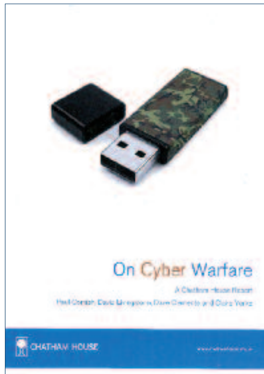
Cover van het rapport 'On Cyber Warfare'

Deze deelstrategie noemt bovendien slechts vijf vitale nationale belangen 26 en mist ten onrechte