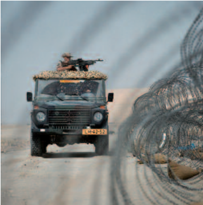
De fysieke bewaking en/of beveiliging van militaire objecten is duidelijk omschreven. Maar het is de vraag of civiele datacenters, servers en internethubs daar ook onder vallen

of het oorlogsrecht van toepassing is op cyberoperaties. Dat blijkt in twee situaties het geval te zijn. Ten eerste als cyberoperaties sec een ‘gewapend conflict’ vormen. Ten tweede als cyberoperaties deel uitmaken van een gewapend conflict en als vijandelikheden kunnen worden beschouwd. We werken beide opties uit.