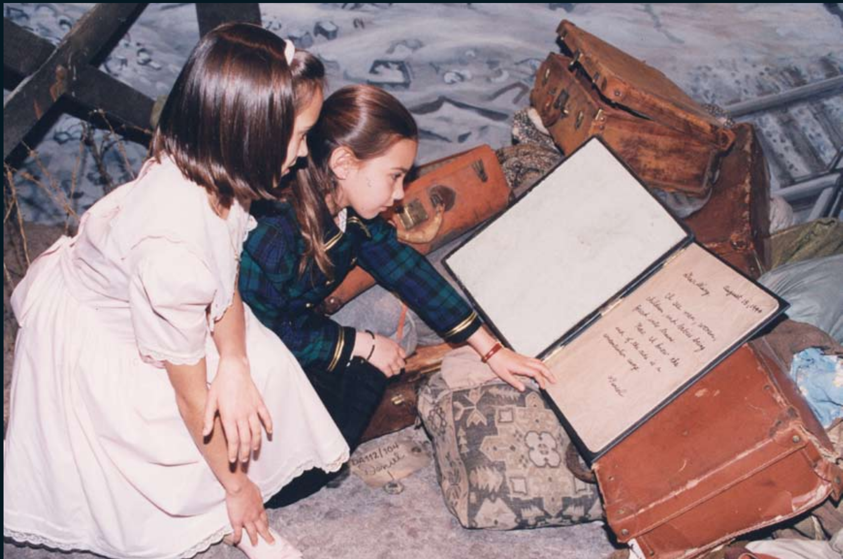
'Daniel's room' en kinderroute