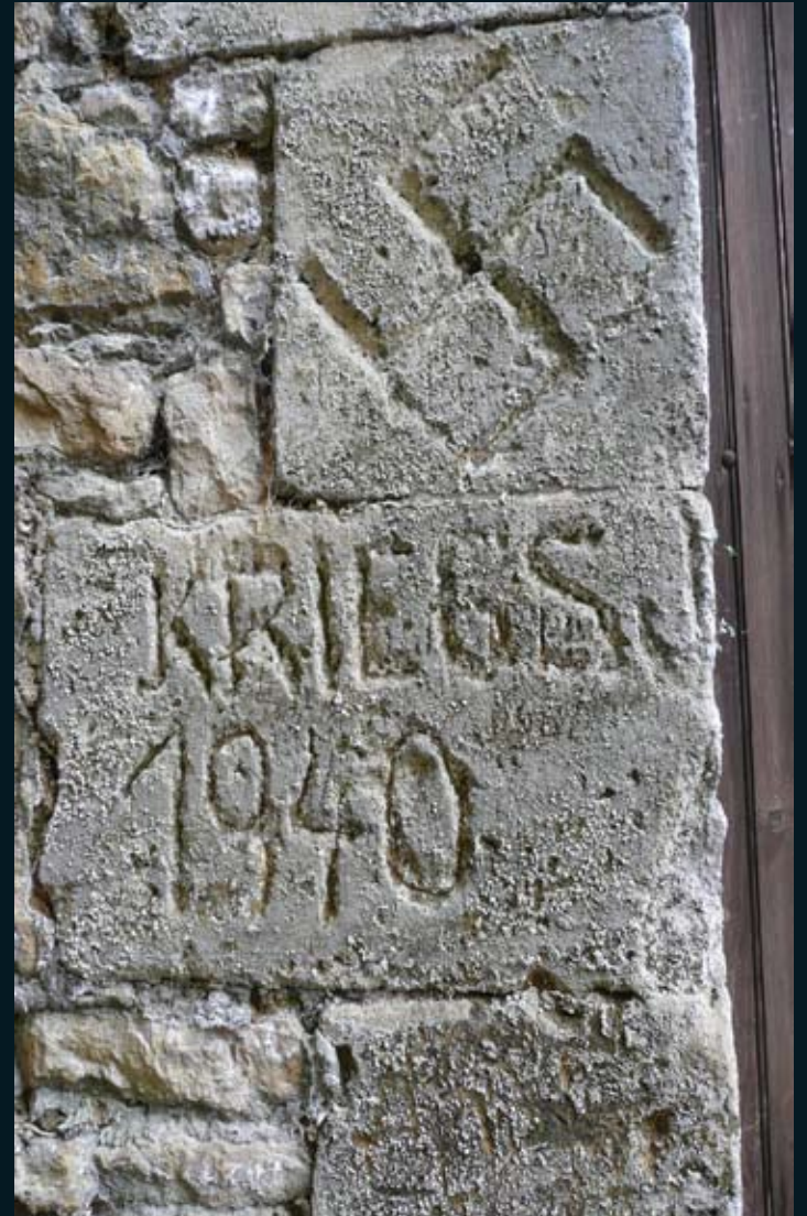
Chateau Fort de Sedan, Frankrijk (foto's auteur)