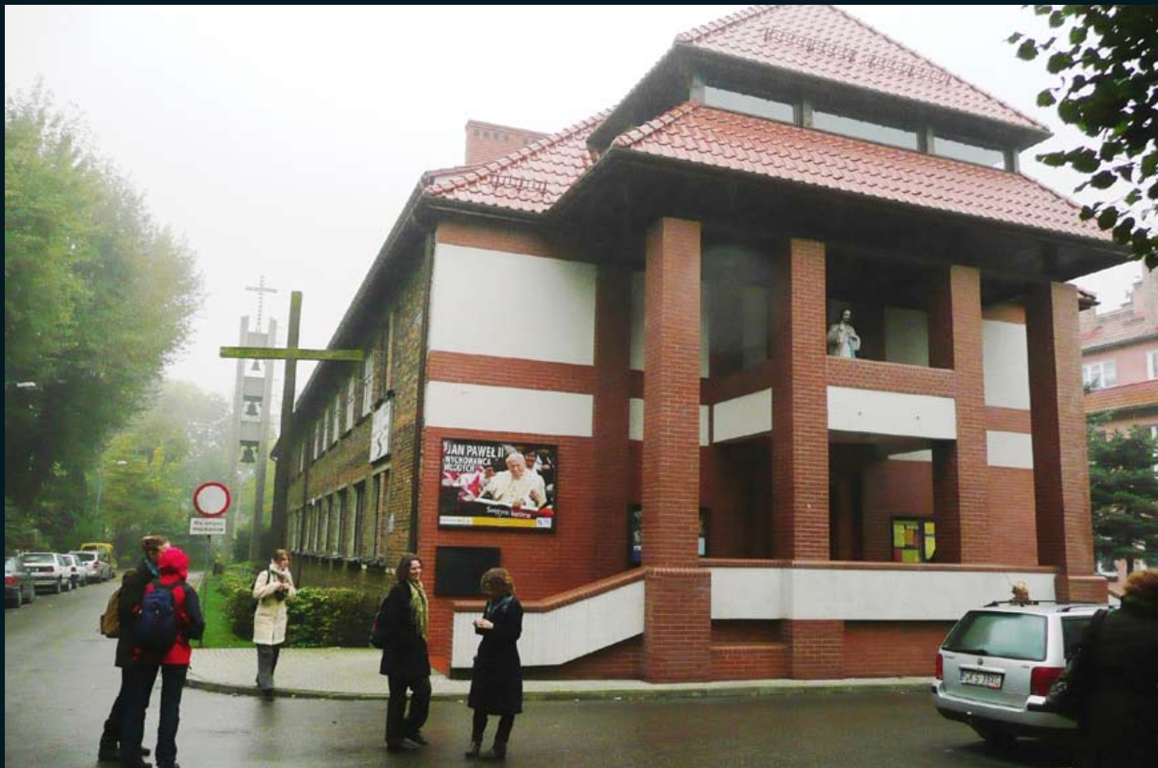
Katolieke kapel in Auschwitz/Oświęcim, 2008