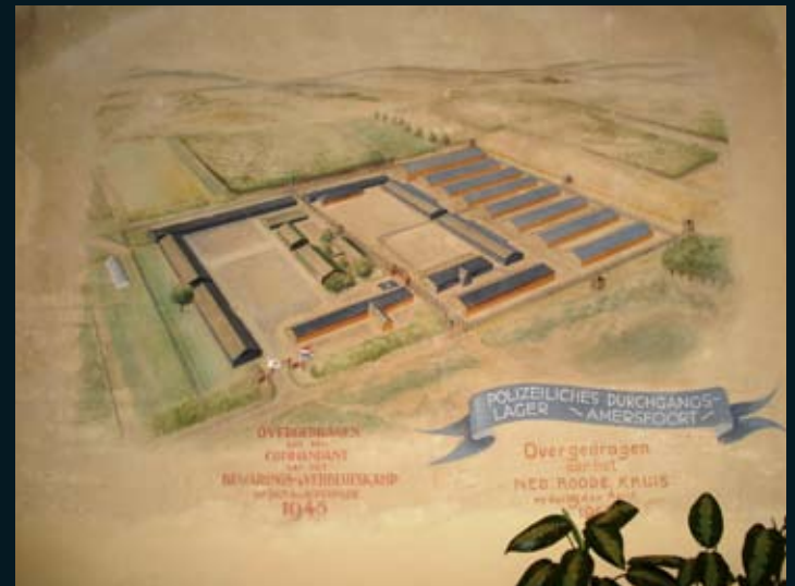
Linkerdeel wandschildering directeurswoning kamp Amersfoort