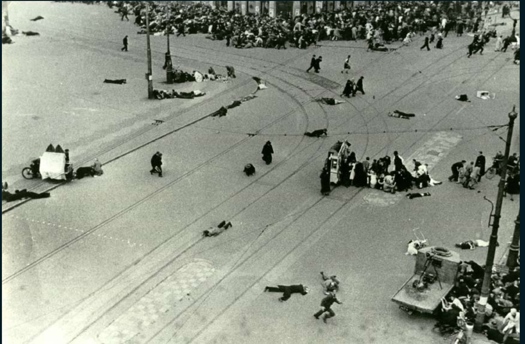
De beschieting op de Dam