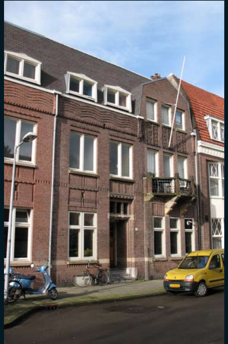
Viottastraat 36, 2007