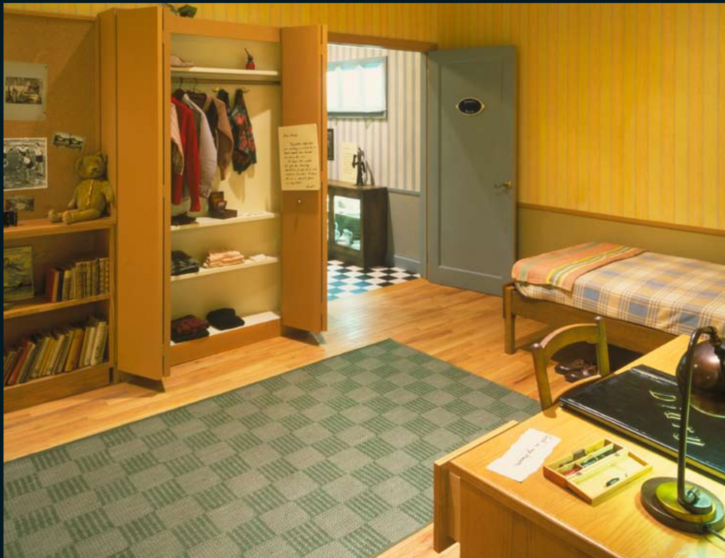
'Daniel's room' en kinderroute