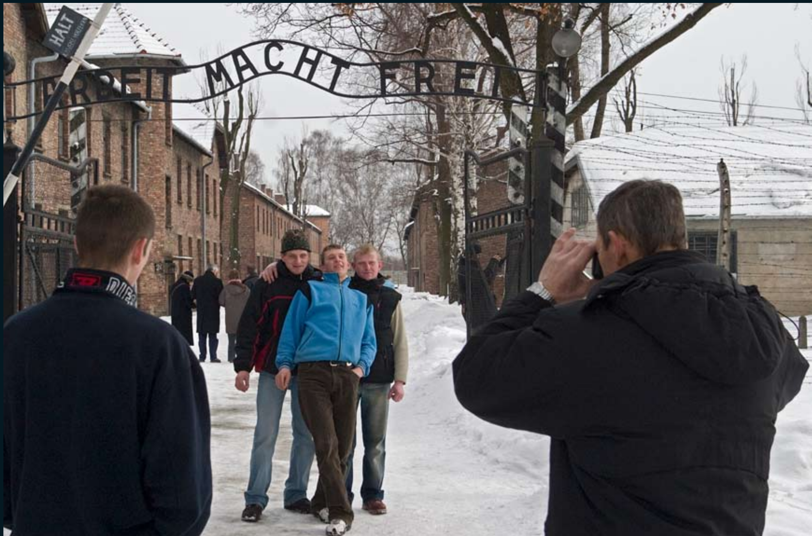
Poort Staatsmuseum Auschwitz-Birkenau