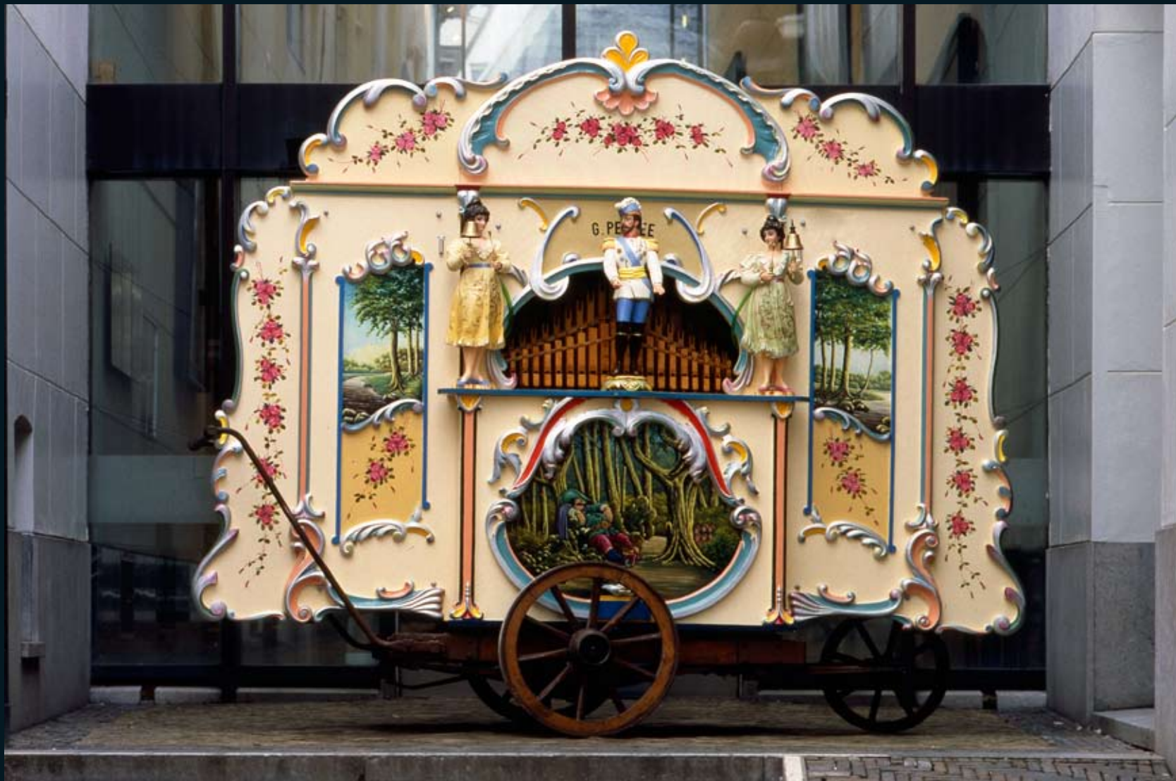
Draaiorgel Het Snotneusje