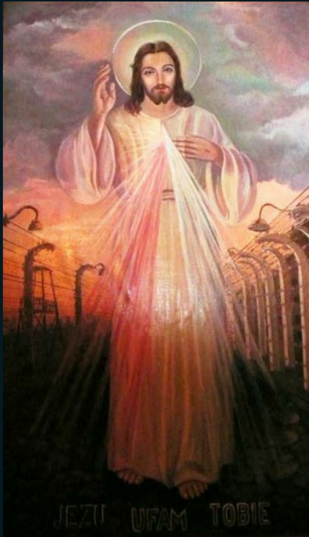
Katholieke kapel in Auschwitz/Oświęcim, 2008