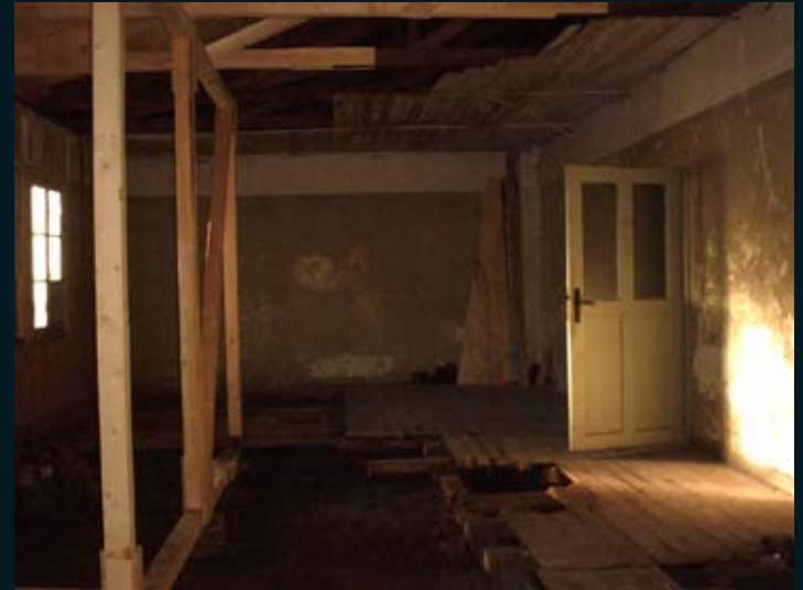
Boven: Streekmuseum Ommen, collectie Kamp Erika, Harold Dokter Beneden: Kamp Stalag X-B Sandbostel (foto Liselotte Neervoort)