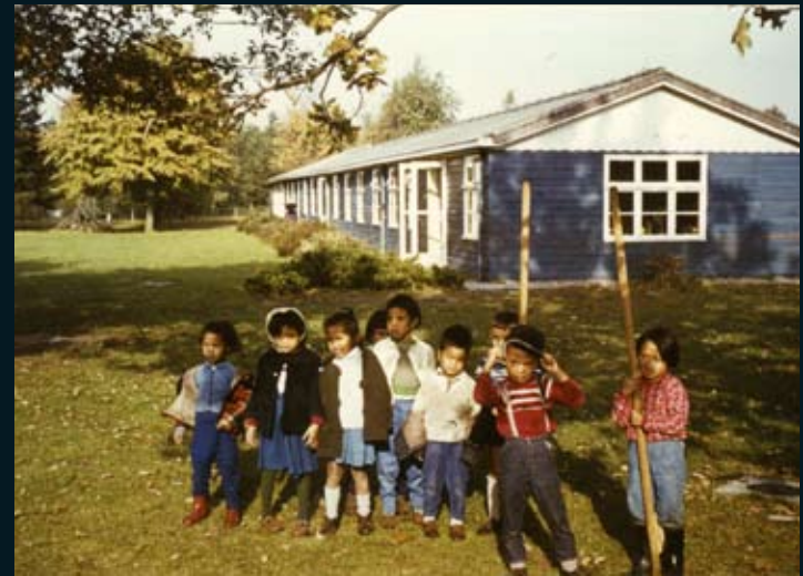
Voormalig kampterrein Westerbork Woonoord Schattenberg