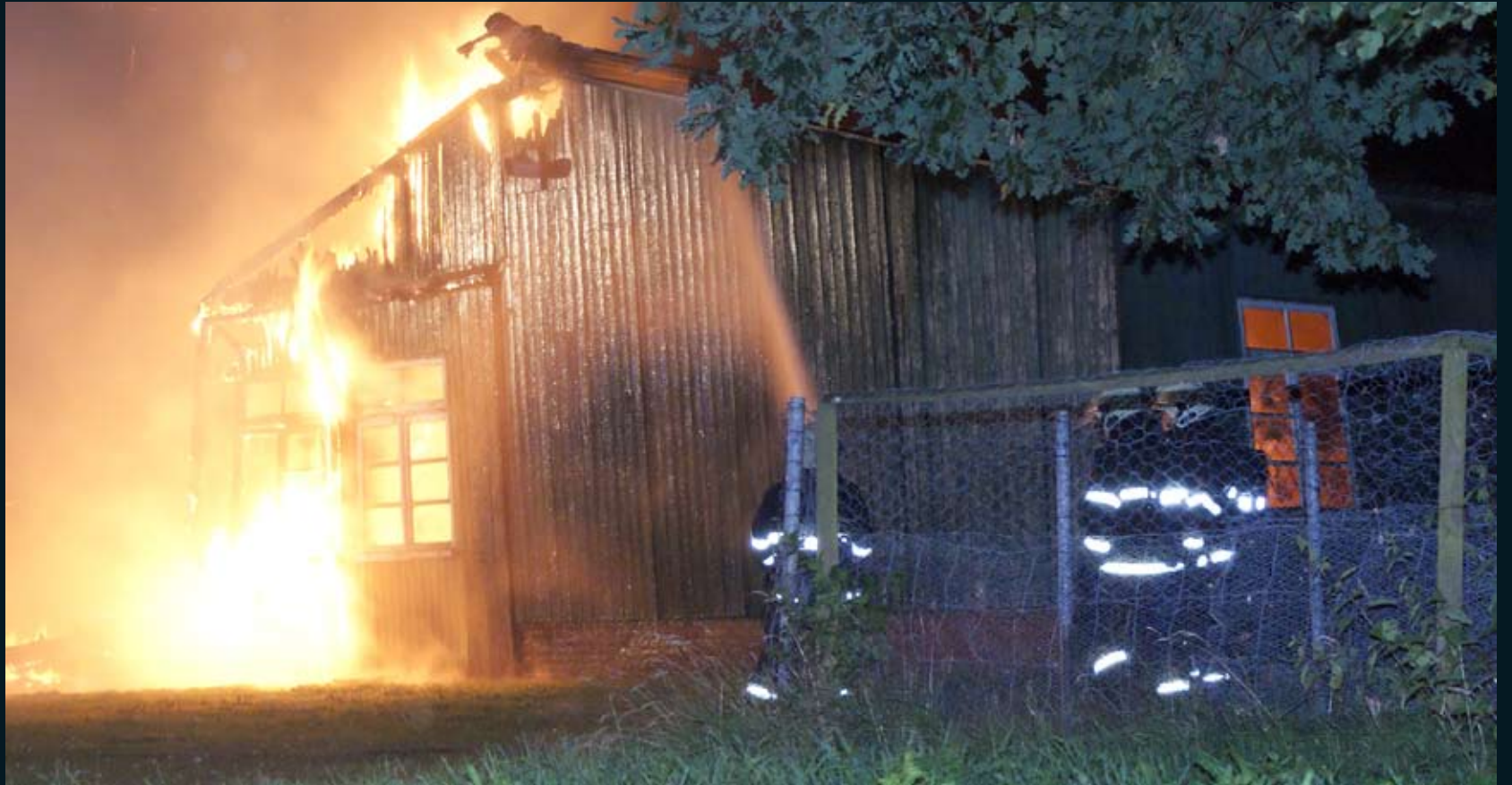
Brand van de Westerborkbarak in Veendam