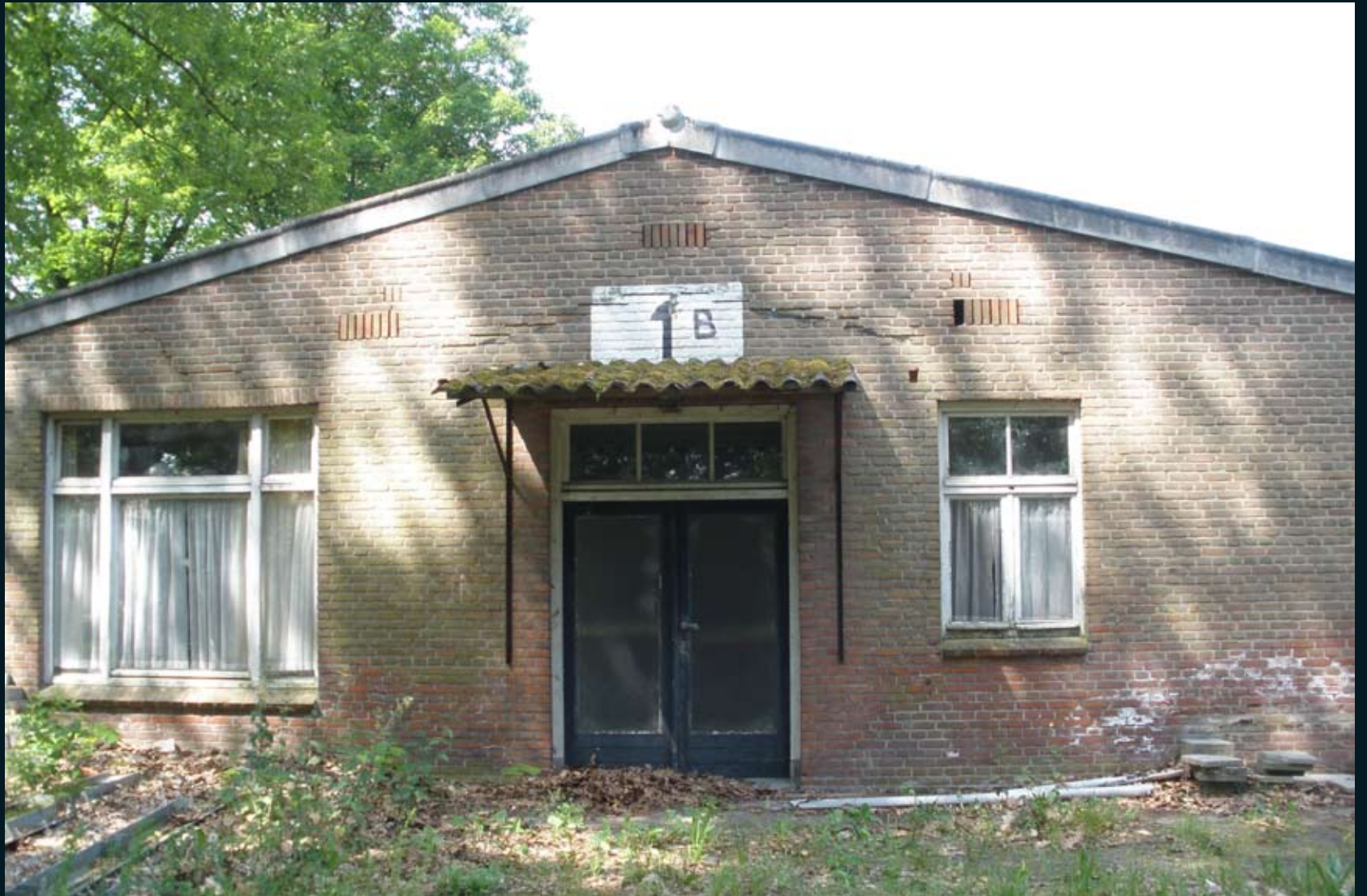
Barak 1B, woonoord Lunetten / Vught