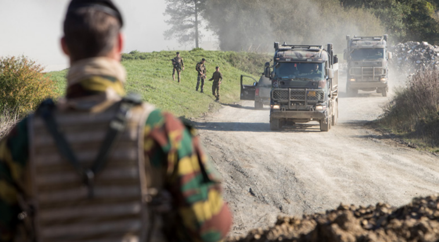
Nederlandse en Belgische militairen trainen samen voor de EU-Battlegroups. Cyberaanvallen blijven mogelijk niet altijd gewelddoos, waardoor de theoretische optie van zelfverdediging open moet blijven

of beëindigen van economische hulp. In tegenstelling tot een represaille is een retorsie wel uit te voeren door een collectief aan landen of een supranationale organisatie zoals de EU. Een retorsie is ook bij een gewapende aanval of na gebruik van geweld in te zetten. Tot slot kunnen staten zich ook beroepen op enkele rechtvaardigingsgronden zoals force majeure , 'distress' als mensenlevens in gevaar zijn, of een beroep op 'necessity' wanneer de essentiële belangen in 'grave and imminent peril' zijn. 56 In de cybercontext is een 'plea of necessity' mogelijk in te roepen bij een zeer ernstige dreiging tegen de vitale infrastructuur. Hierbij is het niet noodzakelijk dat er al een eerdere internationale onrechtmatige daad heeft plaatsgevonden, of dat de dreiging van een staat komt.