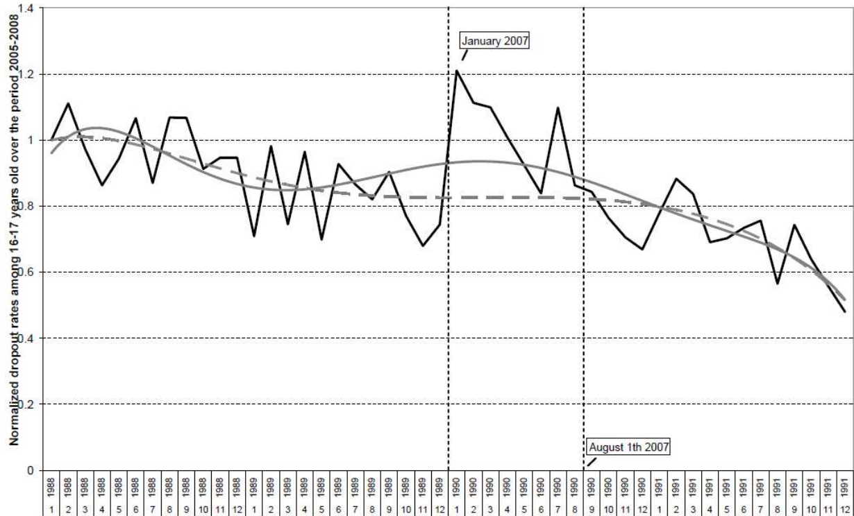
Figuur 1: Parallele tijdstrend

Opmerking: De figuur tekent genormaliseerde gemiddelde maandelijkse uitvalvoeten over de tijdsperiode 2005 (1988), 2006 (1989), 2007 (1990) en 2008 (1991). De volle lijn houdt rekening met alle perioden 2005-2008. De stippelijne houdt geen rekening met het cohort 1990.