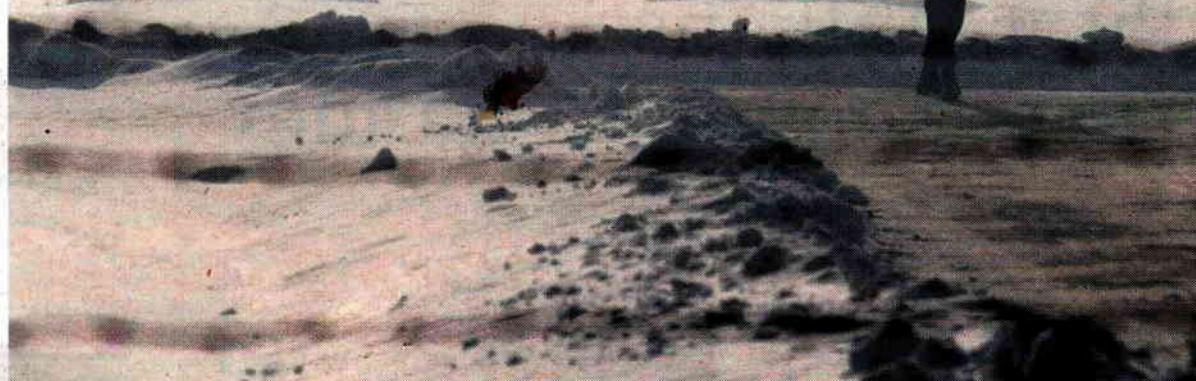
Het ruïnelandschap van Auschwitz-Birkenau is als centrum van de Holocaust het meest schuldige landschap van Europa geworden.

Europa's politieke eenwording van de afgelopen decennia is in belangrijke mate gefundeerd op de illusie van een samenbindend, getraumatiseerd verleden. Het enige wat ons bindt is echter een herinneringskloof. Naoorlogs Europa ligt bezaaid met betwist erfgoed, waarvan niet valt te verwachten dat het