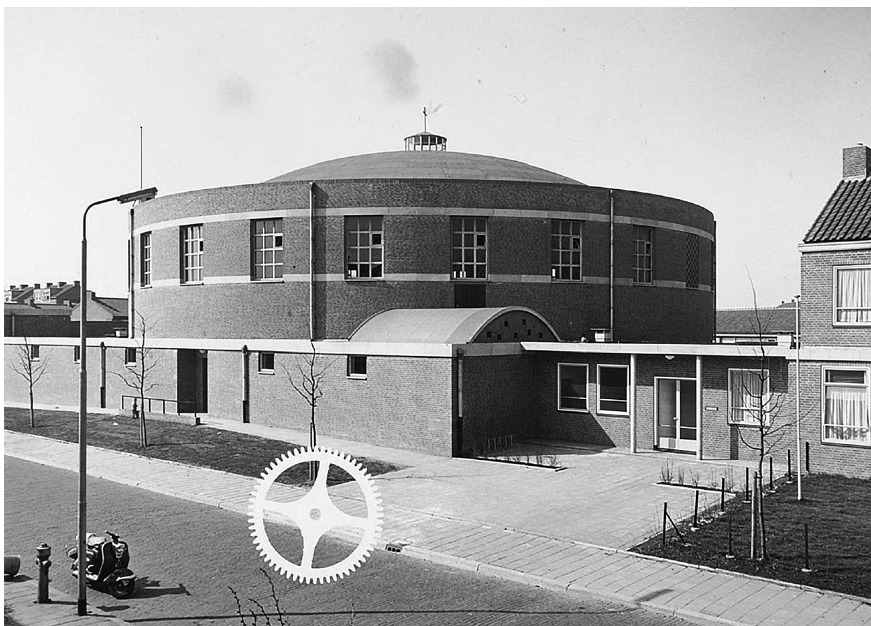
Exterieur en interieur kort na de voltooiing.