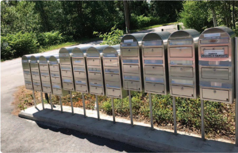
Housing First in Helsinki: een cluster van zelfstandige woonruimtes met elk een eigen adres.

Zorg en ondersteuning worden aangeboden maar niet opgelegd. Het accepteren van begeleiding kent echter niet noodzakelijk een relatie met de woonsituatie van de cliënt. Deze verliest dus niet zijn woning als deze geen begeleiding wenst. Uiteraard wordt er ingezet op zo goed mogelijk samenwerken. In Nederland, met name in een woonvoorziening, mag een cliënt vaak niet blijven als deze niet meewerkt aan zorg. Huurbescherming is in Nederland een onbestaand idee in residentiële woonvoorzieningen. De Finnen draaien dit om, en de redenatie erbij is eenvoudig: een dakloze die een eigen huurwoning betreft (en die woning kan zijn plek hebben in een zorgvoorziening) is vanaf dat moment niet meer dakloos en dus gelijk aan andere Finnen die een huurwoning hebben. Die wordt ook geen verplichte zorg opgelegd. In Nederland is dat op dit moment ondenkbaar. Zo kan het voorkomen dat woningcorporaties verplichte begeleiding eisen als voorwaarde voor het huurcontract bij Housing First. Huur en woonbegeleiding worden in een contract gekoppeld. In feite verliest de huurder daarmee huurbescherming. De corporatie kan iemand uitzetten als de persoon in kwestie begeleiding weigert of als de begeleiding niet tot resultaat leidt, bijvoorbeeld wanneer er veel overlast is voor de omgeving.