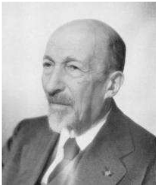
Obr. 2. JACQUES HADAMARD (1865–1963)

Zabývejme se nyní otázkou, kdy platí v (1) rovnost. Bez újmy na obecnosti budeme nadále předpokládat, že \mu = 1 , tj. nerovnost (1) bude tvaru