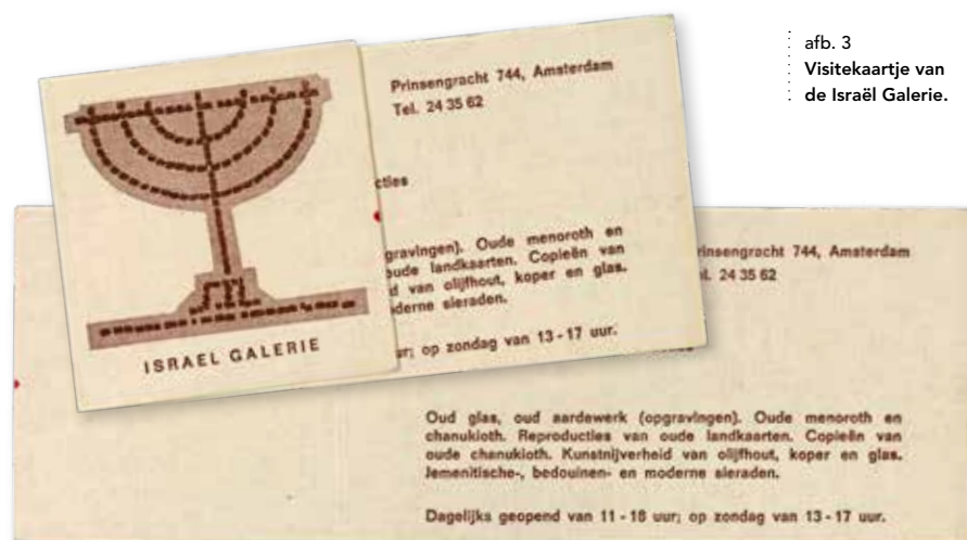
afb. 3 Visitekaartje van de Israël Galerie.