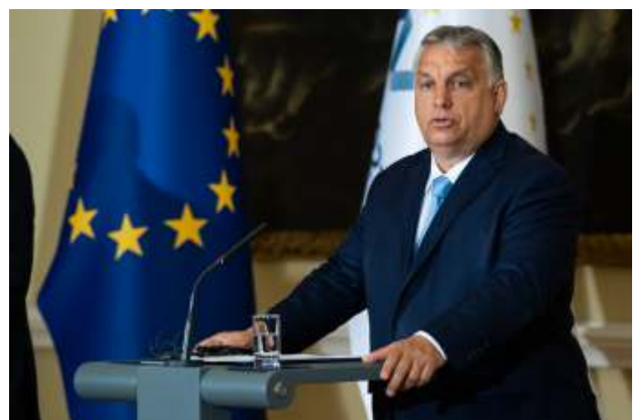
Premier Viktor Orban van Hongarije. Zijn land ziet meer in een staakt-het-vuren dan in het verhogen van de Europese schuldenberg.