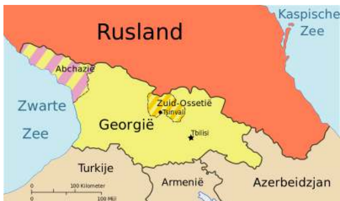
Georgië met Abchazië en Zuid-Ossetië.

14 december 2023 zal de geschiedenis ingaan als de dag dat de EU als geopolitiek project verder ging