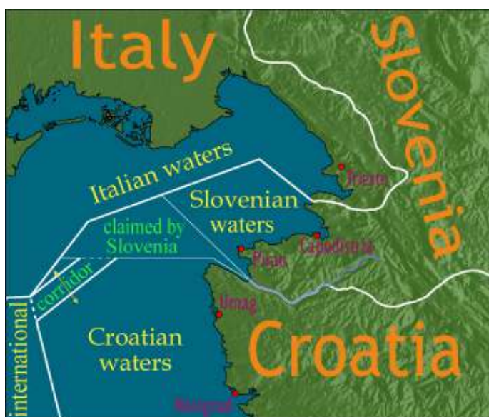
De Baai van Piran.