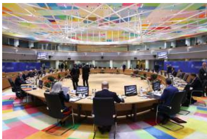
Op de top van de Europese Raad op 14 december jl. zijn Oekraïne, Moldavië en Georgië voorgedragen als kandidaat-lidstaat van de Europese Unie.

Moldavië heeft zich in 1990 tijdens het uiteenvallen van de Sovjet-Unie onafhankelijk verklaard. Een strip tussen de rivier de Dnjestr en de Oekraïens-Moldavische grens, het zogeheten Transnistrië heeft zich echter van Moldavië afgescheiden. Transnistrië wordt voornamelijk bewoond door Russen en etnische Moldaviërs die zich op Moskou oriënteren. Verder zijn in Transnistrië nog steeds Russische legeronderdelen aanwezig die recentelijk nog zijn uitgebreid. De Moldavische regering is er sinds 1990 niet in geslaagd om het gezag over Transnistrië te herstellen.