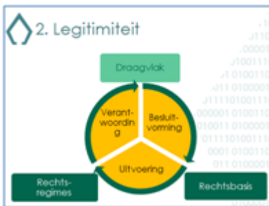
Figuur 2: Legitimiteit

In Tirillo's woorden ligt het legaliteitsbeginsel besloten. Ten eerste moet de krijgsmacht de goede dingen doen: het kwaad bevechten. Ten tweede dient dit op de juiste (strijd)wijze te gebeuren; zo niet dan verwordt de krijgsmacht zelf tot kwaad. Tirillo noemt draagvlak niet met zoveel woorden, maar het belang ervan is er vandaag de dag niet minder om. Ik kom daar zo op terug. Samenvattend: de fundamentele regel van legitimiteit van overheidsoptreden vereist draagvlak, een rechtsgrondslag en respect voor rechtsregels.