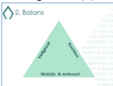
Figuur 3: Balans veiligheid – rechten & vrijheden – welzijn & welvaart

Legitimiteit als brug tussen veiligheid en recht brengt ook een ander spanningsveld in beeld (zie Figuur 3). Collectieve veiligheid maakt economisch en sociaal welzijn en welvaart mogelijk, zoals Hobbes al duidelijk maakte.