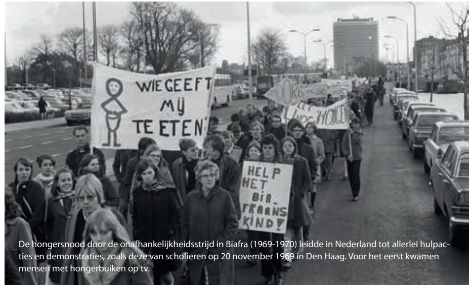
De hongersnood door de onafhankelijkheidsstrijd in Biafra (1969-1970) leidde in Nederland tot allerlei hulpacties en demonstraties, zoals deze van scholieren op 20 november 1969 in Den Haag. Voor het eerst kwamen mensen met hongerbuiken op tv.