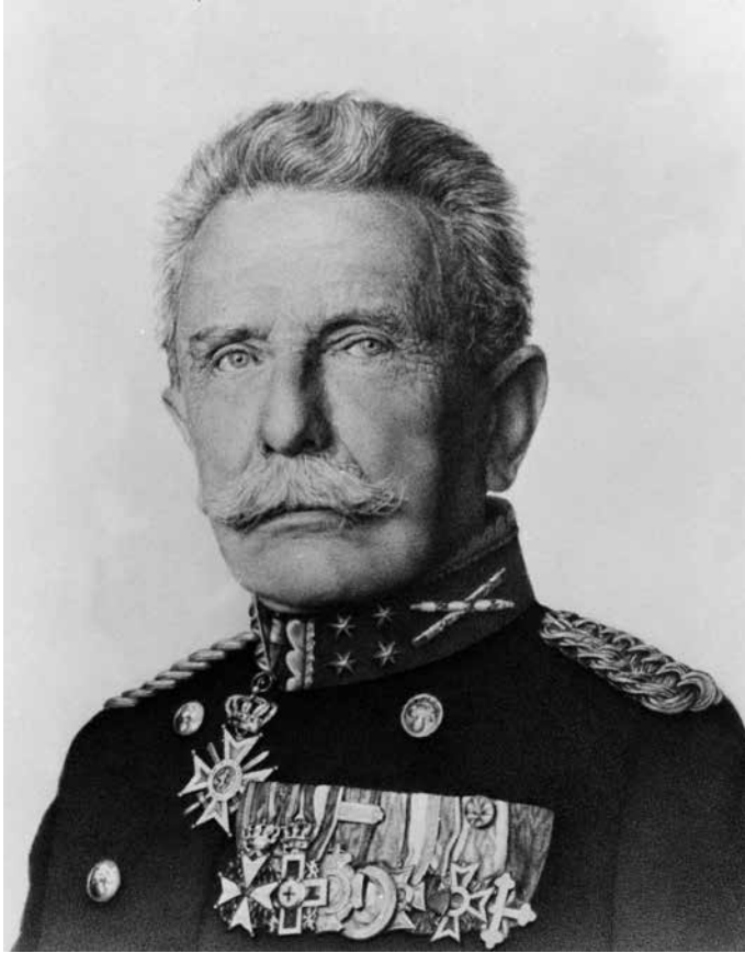
De grondlegger van de Nederlandse luchtvaart, C.J. Snijders, hier afgebeeld als generaal in zijn functie van opperbevelhebber van Land- en Zeemacht (1914-1918).