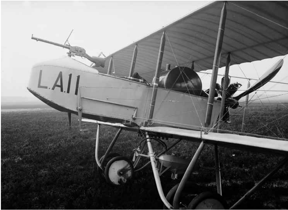
Een Farman HF22-vliegtuig met de Madsen-mitrailleur voor op de bemanningsgondel gemonteerd.