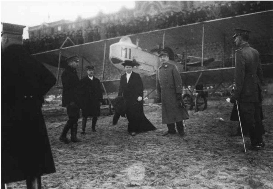
Koningin Wilhelmina en generaal Snijders inspecteren op het strand van Scheveningen de vliegtuigen die deelnemen aan de militaire rondvlucht op 6 maart 1916. Geheel links kapitein Walaardt Sacré.