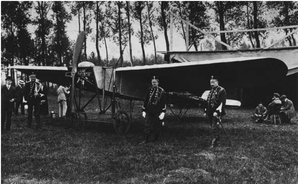
Een Blériot-vliegtuig voor een vliegtuigent op het tijdelijke vliegveld bij De Pettelaar tijdens de herfstmanoeuvres in september 1911. Deze oefening toonde het nut van een vliegdienst voor het Nederlandse leger duidelijk aan.