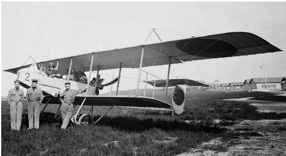
Een vliegtuig van de Koninklijke Marine op Soesterberg: de Farman HF22 met kenmerk M2 met enkele leden van het marinedetachement.