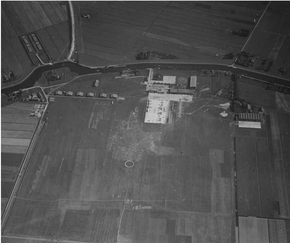
Het vliegveld Schiphol in de jaren twintig. Van links naar rechts: de militaire kazerne, de zes militaire hangars, het stationsgebouw met het platform voor verkeersvliegtuigen, de KLM-hangars met daarachter de Fokkerloods en helemaal rechts de grote KLM-hangar.