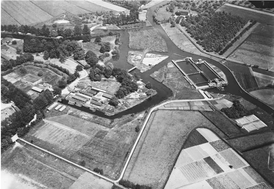
Luchtfoto van het naast de Utrechtse Kromhoutkazerne gelegen Fort Vossegat, dat in 1886 de eerste thuisbasis van de Nederlandse militaire luchtvaart was. Daar werd het ballonpark 'Lachambre' van de Genie ondergebracht.