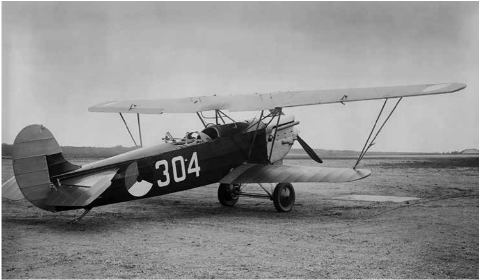
Het Fokker c.v-tweepersoonsjachtvliegtuig. Gelet op de prioriteit van de verkennings- en waarnemingsdienst waren de jachtvliegtuigen vooral bedoeld ter bescherming van de verkenningsvliegtuigen.