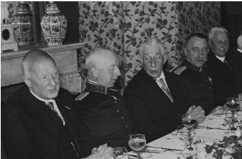
De beleidsverantwoordelijken van het tienjarenplan voor de uitbreiding en modernisering van het Nederlandse luchtwapen: minister H. Colijn tussen de generaals I.H. Reijnders (links) en M. Raaijmakers (rechts) tijdens de lunch ter gelegenheid van Colijns afscheid als minister van Defensie op 26 juni 1937.