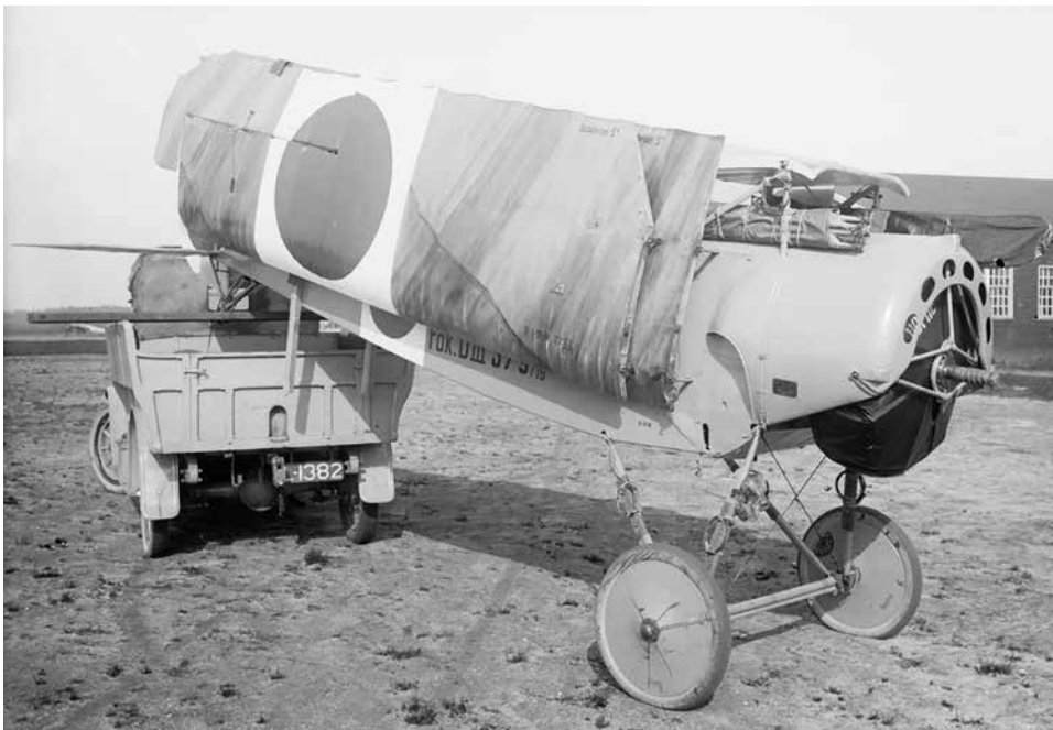
Aankomst van een in het najaar van 1917 per spoor uit Duitsland aangevoerd Fokker D.III jachtvliegtuig.