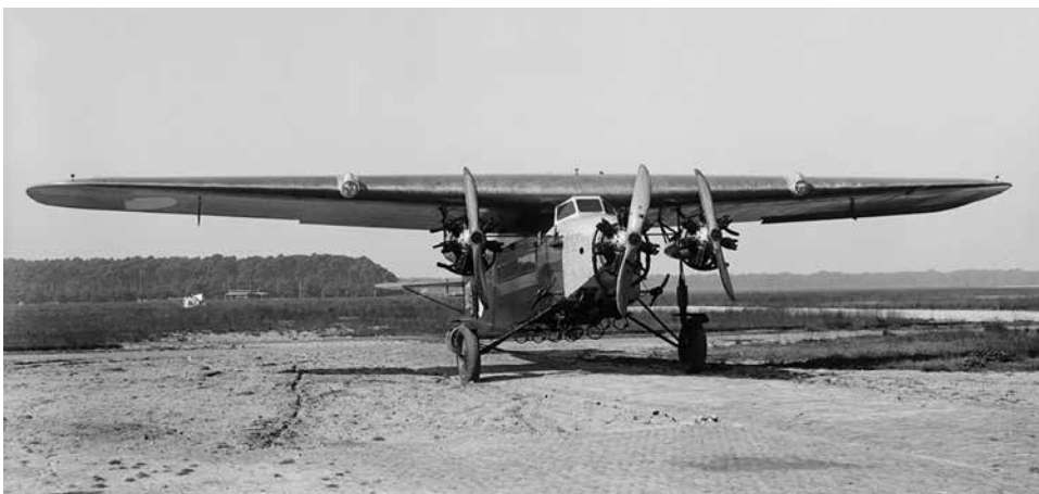
In 1927 schafte de LVA drie Fokker F.VIIa/3m-vliegtuigen aan om de vordering van KLM-vliegtuigen als bommenwerpers in vreedstijd voor te bereiden en de bomrekken te beproeven.