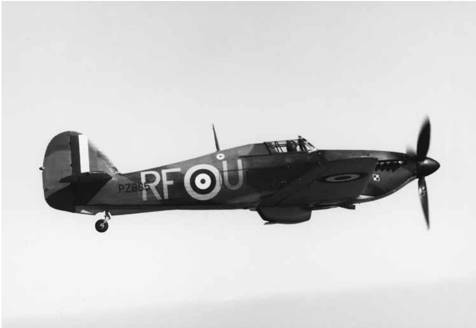
Een Hawker Hurricane. De generaals Reijnders, Raaijmakers en Best adviseerden minister Van Dijk unaniem tot de snelle aanschaf van deze moderne Britse luchtverdedigingsjager, maar de minister koos toch voor de Fk.58 van Koolhoven.