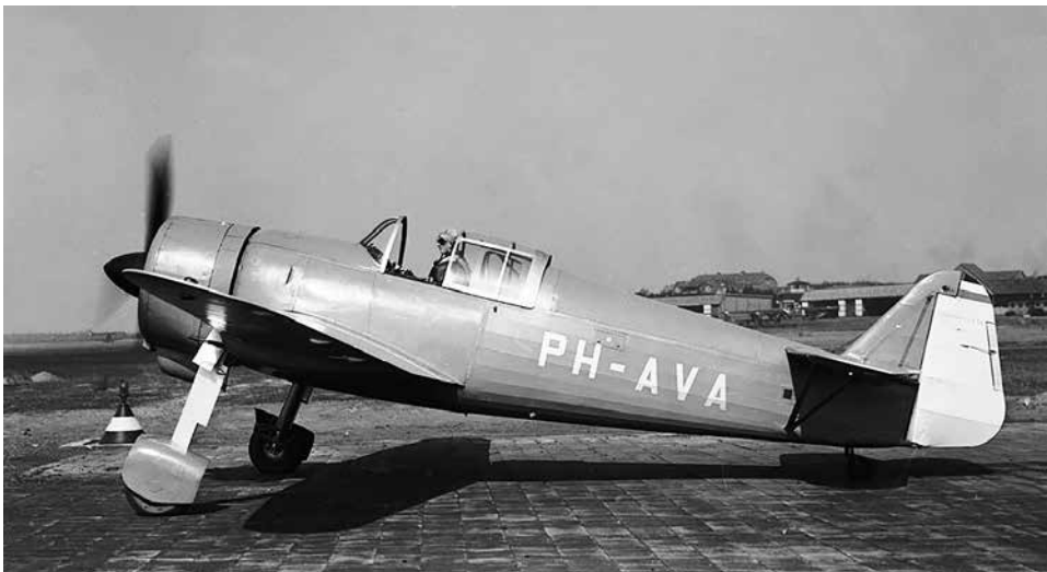
Het prototype van de Koolhoven FK.58-jager was in april 1939 ter beproeving door verschillende vliegers van de Militaire Luchtvaart op Soesterberg. Door de gewenste wijzigingen en het Britse embargo op de Taurus-motoren werd geen van de 36 bestelde FK.58's geleverd.