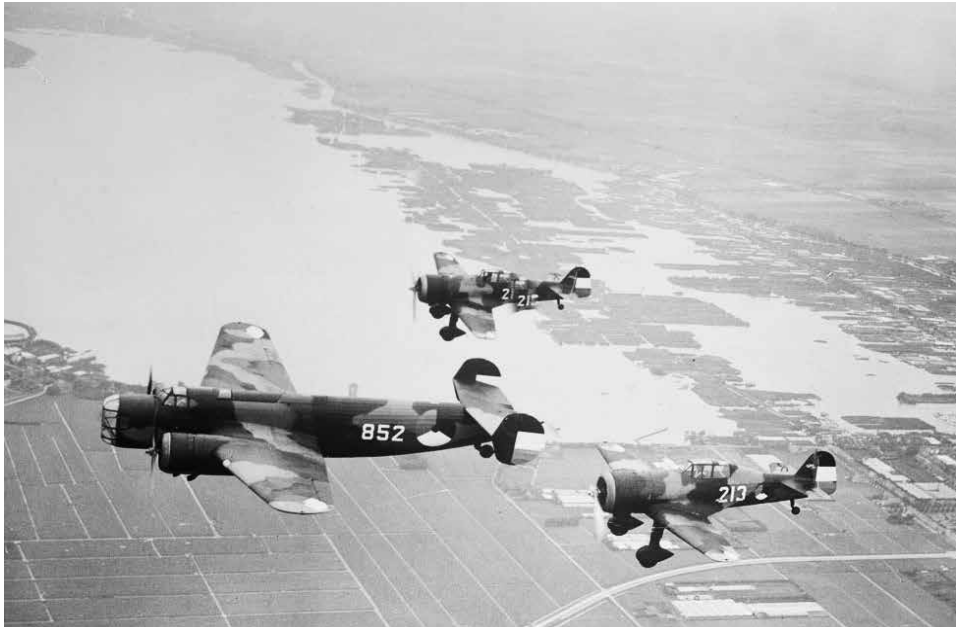
Ten tijde van de mobilisatie van 1939 was de Fokker T.V als luchtkruiser verouderd en werd het toestel ingezet als bommenwerper, hier geëscorteerd door twee Fokker D.XXI-jachtvliegtuigen.