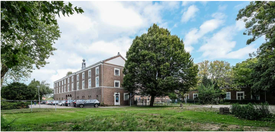
Afb. 3. Voorgebouw vanuit het zuiden.