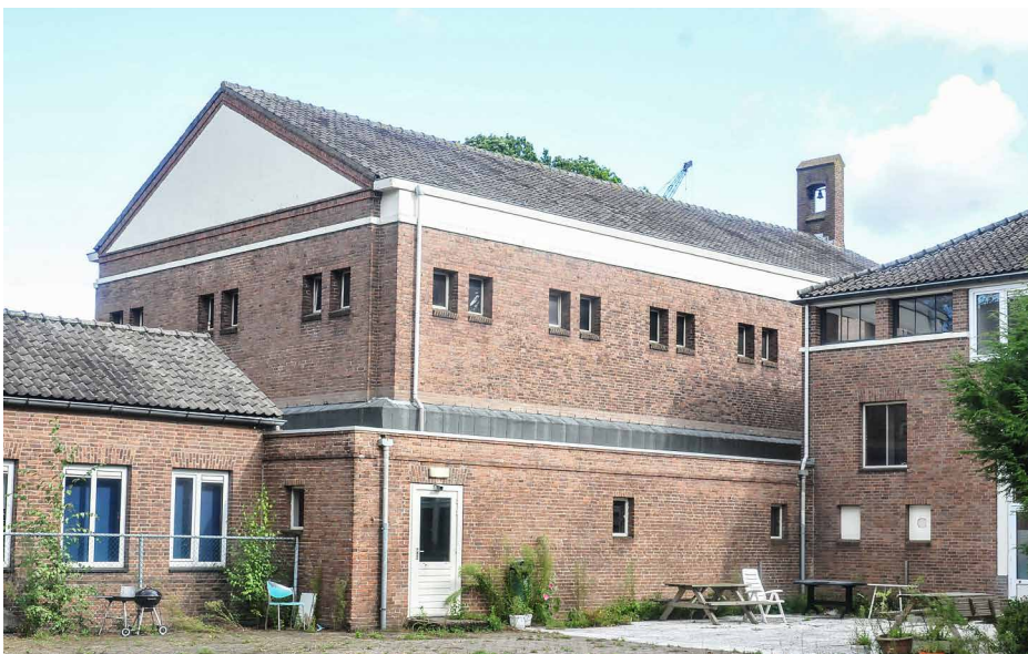
Afb. 5. De kapel vanuit het zuidwesten.