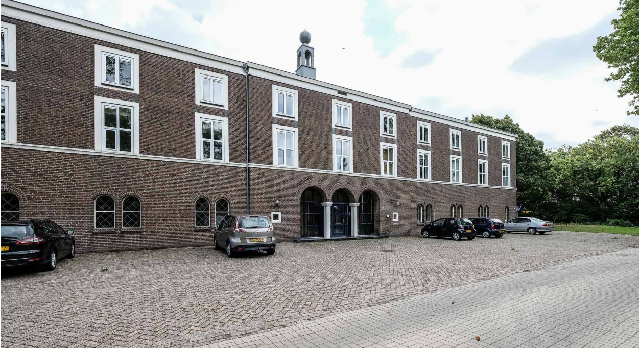
Afb. 2. Voorgebouw met de entree.