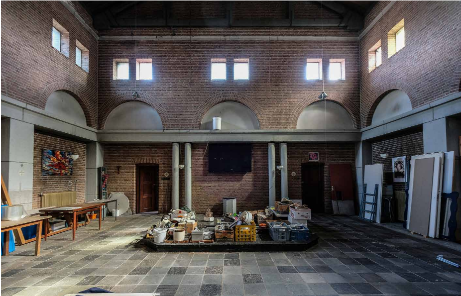
Afb. 6. Interieur van de kapel naar het oosten.