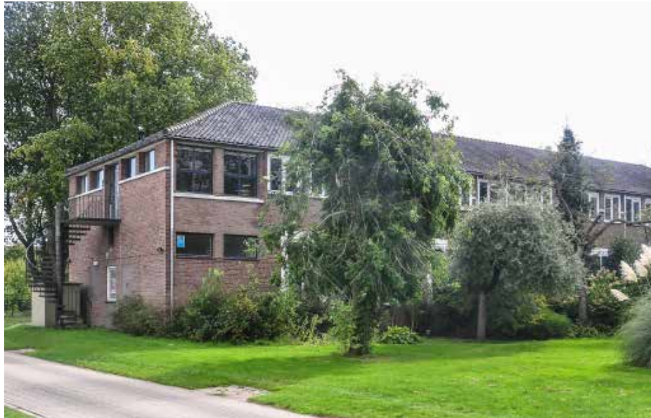
Afb. 7. Uiteinde van de noordvleugel.