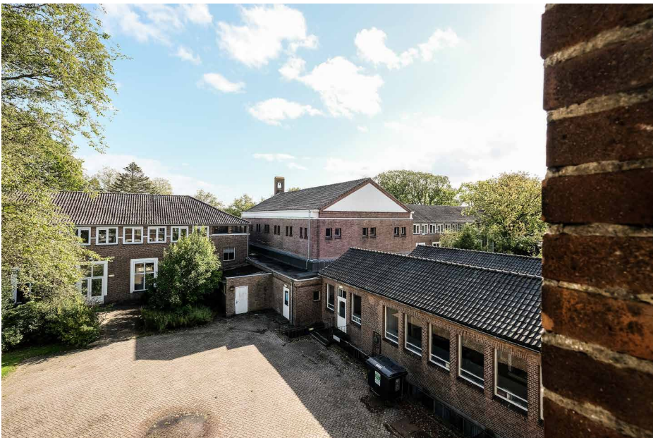
Afb. 4. De kapel in het midden met rechts daarvan het verbindingsdeel met het voorgebouw.