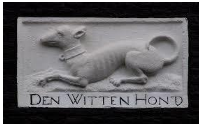
Afb. 3 Gevelsteen Witte Hond , Warmoesstraat 16.

Gezien de gunstige ligging in het stedelijke verkeersnetwerk en de aanwezigheid van een kapitaalkrachtige elite van beurshandelaren en bestuurders is het weinig verwonderlijk dat herbergiers zich graag in de Warmoesstraat vestigden. 190 Met een gemiddelde breedte van vijf meter, een diepte van zeven meter en hooguit drie verdiepingen met een kelder en zolder als opslagruimte waren de huizen niet bijzonder groot. Zeker vergeleken met de weelderige natiehuizen in Brugge en de indrukwekkende Italiaanse en Noord-Afrikaanse fondacos uit dezelfde periode ging het om bescheiden gebouwen. 191 Achter de voordeur lag het voorhuis met de gelagkamer en weer daarachter kwam de bezoeker in een lagere ruimte die als keuken kon dienen. Boven de keuken was een extra vertrek of ‘insteek’. De achterhuizen waren dikwijls in gebruik als pakhuis of tweede keuken: ze lagen rechtstreeks aan het water van het Damrak, de veilige binnenhaven waar transportschippers hun schuiten konden aanmeren. Tussen de entree en het drinklokaal aan de voorzijde van de levendige Warmoesstraat en het achterhuis lag soms een open binnenplaatsje. 192 Halverwege de vijftiende eeuw zat herberg de Witte Hond (ter hoogte van Warmoesstraat huidig nr. 16), dicht naar de haven toe en met het achterhuis direct grenzend aan het Damrakwater. Aan de achterkant van het pand, tussen de tweede en derde verdieping van de Damrakgevel, is nog altijd de zeventiende-eeuwse gevelsteen met een wit hondje te zien (afb. 3). 193