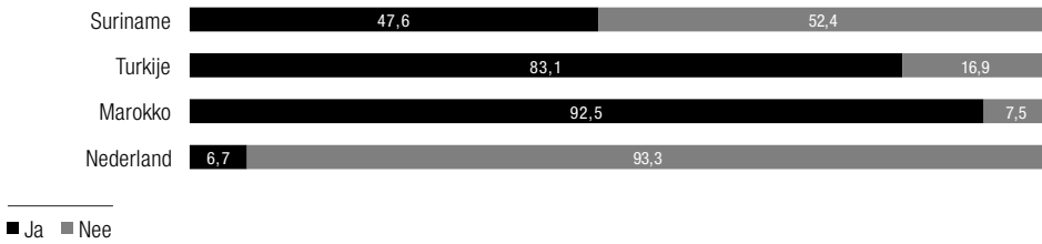
Figuur 3.3 Behoren tot een godsdienst, kerk of religieuze groepering (in % naar geboorteland ouders)