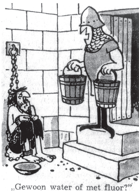
Fig. 3: Gedurende het debat over de drinkwaterfluoridering verschenen met grote regelmaat cartoons in de landelijke en regionale dagbladen. Deze cartoon liet de keuzemogelijkheid zien die de Nederlandse gemeenten hadden vanaf 1960.

Volksgezondheid op het punt van de juridische aanbevelingen ter harte had genomen, dan had voortgang van de drinkwaterfluoridering er mogelijk anders uitgezien.