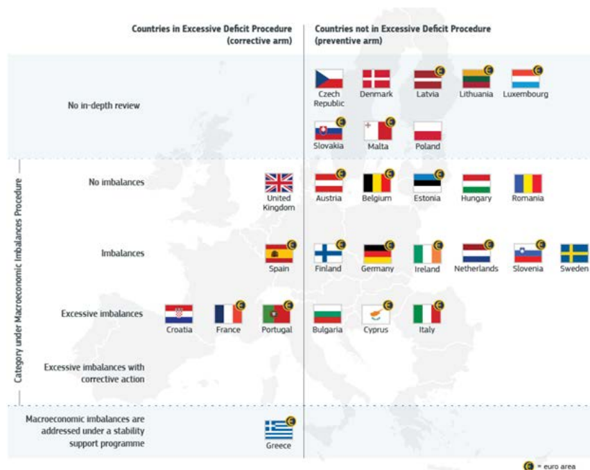
Figuur 3 EU-landen onder de MIP in 2016