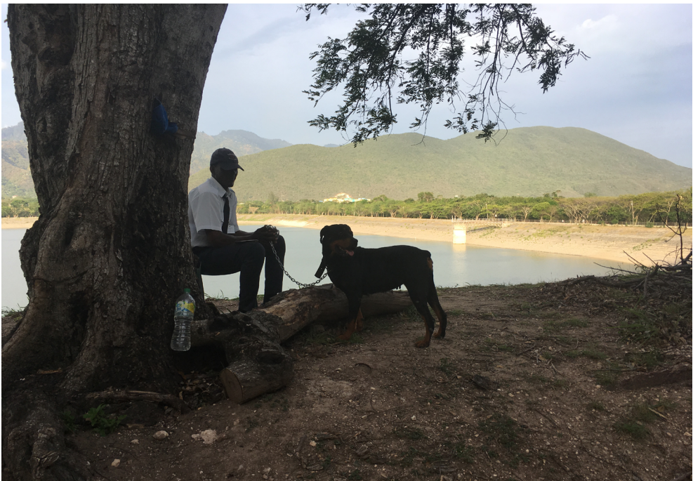
Abb. 3 Arbeitsbeziehungen zwischen Spezies

Solche Mechanismen des räumlichen Einsatzes und sensorisch-afektiven Trainings können zur Reproduktion urbaner Ungleichheiten beitragen, wobei Hunde die Grenzlinien zwischen den Menschen aus Uptown- und Downtown-Kingston sowohl physisch als auch symbolisch überwachen.