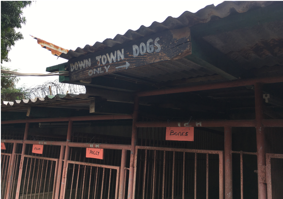
Abb. 2 „Downtown dogs only“ – nur Downtown-Hunde

Dieses Unternehmen war stolz darauf, über eine bestimmte Hunderasse zu verfügen, die als ebenso schön wie aggressiv galt – aber für das jamaikanische Klima weitgehend ungeeignet war, da sie zu Überhitzung neigte und oft an „Blähungen“ litt. Diese Hunde, so der Zwingerleiter, seien eine Uptown-Rasse. Er würde sie nicht nach Downtown schicken: „Sie sind zu schön, man würde keine Schönheit da hinschicken ... die schickt man da hin, wo sie sich wohler fühlen. Die würde ich nicht in Downtown einsetzen, niemand dort würde sie bedrohlich finden.“ Angesichts der geographischen Gegebenheiten Kingstons gab es neben dem ästhetischen Aspekt aber auch noch einen biologischen Grund für den Einsatzort dieser speziellen Hunderasse: Ihre Hitzeempfindlichkeit bedeutete, dass sie in der kühleren, grüneren Hügellandschaft von Uptown besser zurechtkamen als in den heißeren, tiefer gelegenen und dicht bebauten Vierteln der Downtown.