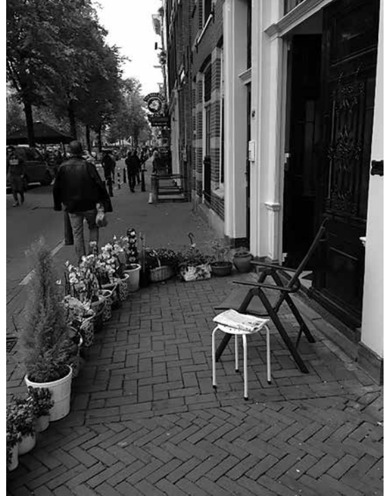
Figuur 2 Tactiek om de publieke ruimte toe te eigenen

Een andere bewoner ervaart het probleem van de drukte in een handeling die voor Amsterdammers centraal staat in hun alledaagse leven: fietsen. Hij vertelt dat de binnenstad steeds autoluwer wordt, waardoor toeristen de stad als voetgangersgebied beleven: "Het straalt een toegankelijke sfeer uit en tegelijkertijd zorgt het ook voor een specifiek soort drukte: mensenmassa's die allemaal weer even verbaasd zijn dat je met de fiets er doorheen wilt" (bewoner, 28 oktober 2014). Tijdens de zomermaanden van 2010 en 2011 ontwikkelt deze bewoner een creatieve tactiek om in de massa te manoeuvreren: "Een fluitje had ik dan om