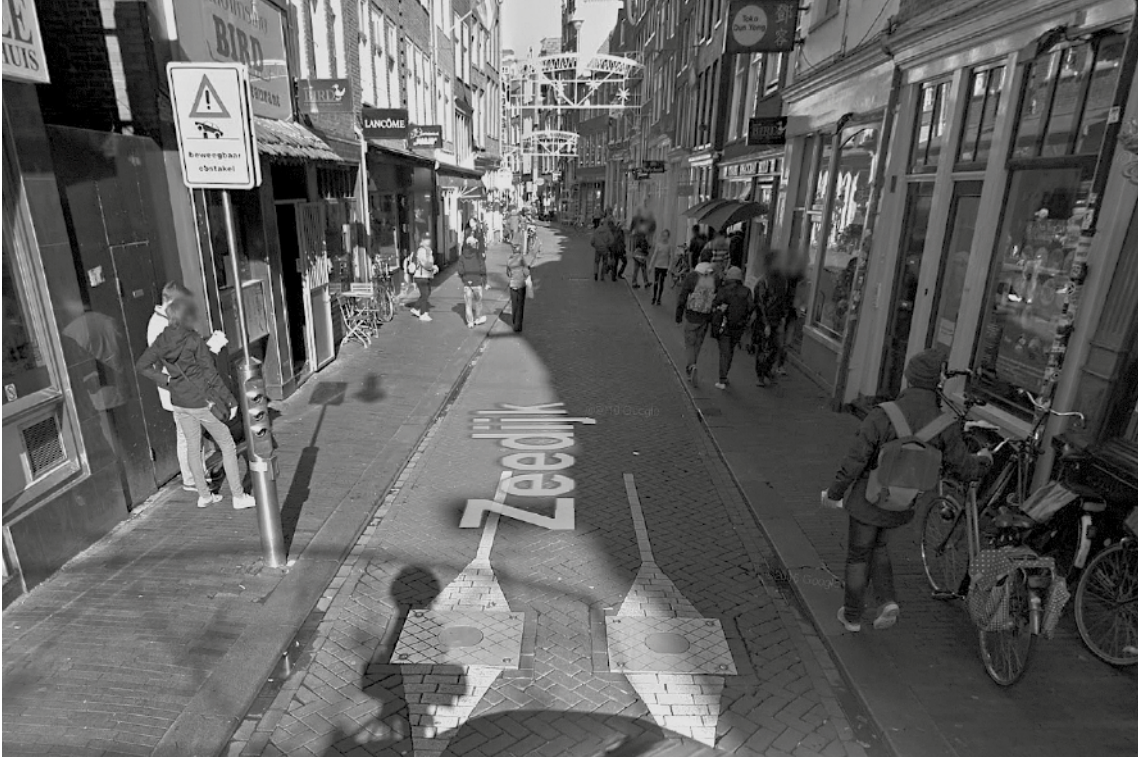
Bewegbaar opstapel

mende criminele infrastructuur in het postcodegebied 1012 te doorbreken en het gebied economisch te verbeteren. Tussen 2007 en 2014 worden vele bordelen gesloten, vastgoed wordt door de gemeente opgekocht en er wordt integraal gewerkt aan veiligheid, leefbaarheid en sociale cohesie (Gemeente Amsterdam, 2014). Een belangrijke pijler van het project is het opwaarderen van de wijk door zogenoemde laagwaardige economische functies – zoals coffeeshops, sekswinkels en minisupermarkten – te transformeren in kwalitatieve en hoogwaardige functies – zoals hippe horeca, kunstateliers en chocolaterie. Deze plannen zijn inmiddels doorgevoerd en de gemeente Amsterdam komt in de voorgangsrapportage (2014) tot de conclusie dat bewonersaantallen zijn gestegen