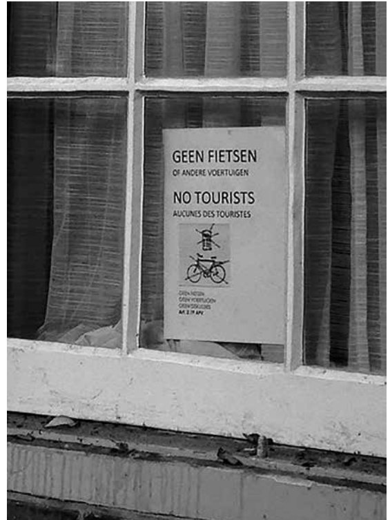
Figuur 3 Omgaan met overlast van toeristen

Om burgers te betrekken bij beleid gebruikt de gemeente verschillende strategieën. Deze geïnstitutionaliseerde momenten voor inspraak bieden een uitlaatklep voor ervaringen van overlast. Zo is er de klachtenlijn van de gemeente waar bewoners via internet of telefoon overlast kunnen melden. Een buurtbewoner ziet echter een paradox: “Dan zeggen ze bijvoorbeeld, ‘wilt u zoveel mogelijk bellen want dan kunnen we er een zaak van maken, en dan kunnen we dat opbouwen’. En dan bel je een paar weken later, en dan krijg je iemand anders, ‘wilt u niet zo vaak bellen