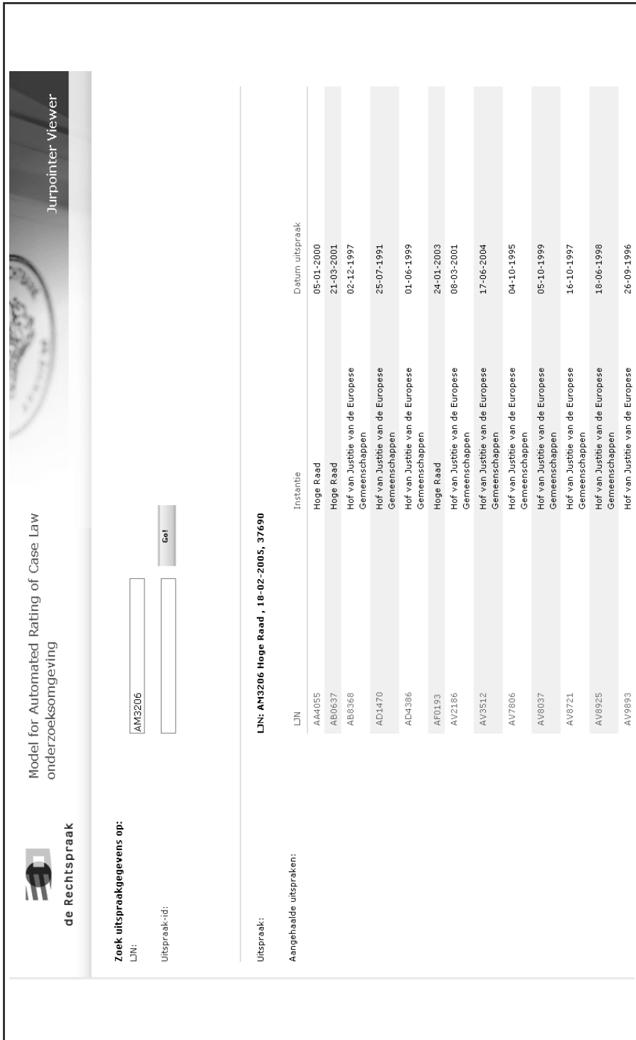
Figuur B-1. Jurpointer-viewer: LJN:AM3206 is gevonden. Als eerste worden de door dit arrest aangehaalde uitspraken getoond.