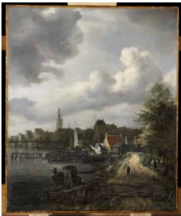
De oude Blauwbrug met rechts daarachter de skyline van Vlooienburg en in de verte de Zuiderkerktoren, rond 1655. Jacob van Ruisdael, De Amstel bij Amsterdam, gezien naar het noorden, ca. 1655. Szépművészeti Múzeum, Boedapest

Halverwege de achttiende eeuw is er meer bekend over de welstand van de bewoners en hun verspreiding over het eiland. Een belastingregister uit 1742 bevat alle hoofdbewoners die meer dan zeshonderd gulden per jaar verdienen. Die inkomensdrempel haalde minder dan de helft van de in totaal 250 huishoudens op Vlooienburg. Deze renteniers, kooplieden en succesvolle middenstanders woonden vooral in de deftige Zwanenburgerstraat en langs de burgwallen. Twee derde van de rijkste bewoners was Joods. Verrassend vaak waren zij van Asjkenazische herkomst, zoals een boekhouder, porseleinverkoper,