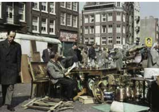
Waterlooplein ca. 1963, met op de achtergrond Vlooienburg

Meer over de geschiedenis van Vlooienburg in: Maarten Hell, Verloren wereld in de Amstelbocht. Leven op Vlooienburg, 1600-1815 (Amsterdam 2024).