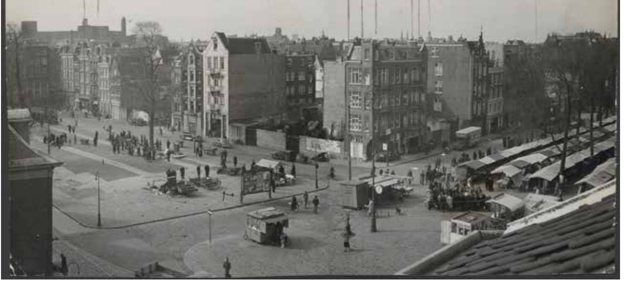
Waterlooplein in 1949

geografische achtergronden ontmoetten buurtbewoners elkaar dagelijks in de eigen straat, gang of bij de gedeelde waterputten achter de huizenblokken. Bewoners zonder eigen pomp moesten daar handmatig emmertjes water halen en kwamen zo in aanraking met buurtgenoten. Ook winkels waren ontmoetingsplaatsen, zoals een Duits-lutherse bakkerij en de Venetiaanse kruidenier in de Korte Houtstraat.