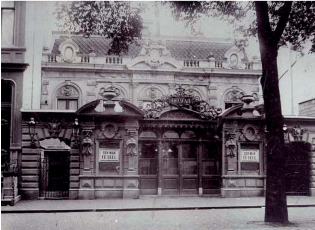
6 W.G. Kuijer & zonen, Schouwburg Frascati, poort aan de Plantage Middenlaan na de verbouwing

van 1892 in 1900. Theatercollectie Bijzondere Collecties UVA (Stichting TIN) (520200011.002 E).