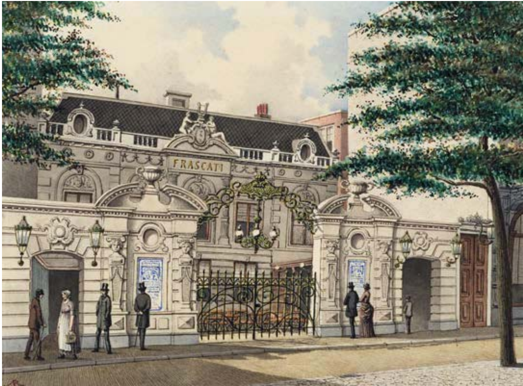
1 J.M.A. Rieke, Schouwburg Frascati aan de Plantage Middenlaan 4a in 1890. Potlood, pen en

aquarel. Theatercollectie Bijzondere Collecties UvA (Stichting TIN) (to04062.000).