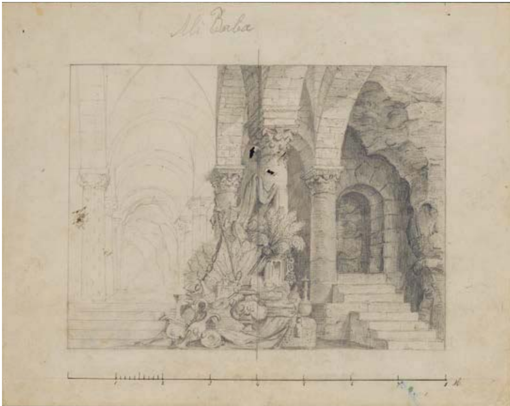
2 Gustave Prot, Decorontwerp voor Ali Baba (Charles Lecocq), voorstellende in het midden een uitstalling van oosterse schatten, met rechts een trap

en ingang in een rots en links een doorkijk. Theatercollectie Bijzondere Collecties UVA (Stichting TiN) (to06588.000/bTLI12-32).