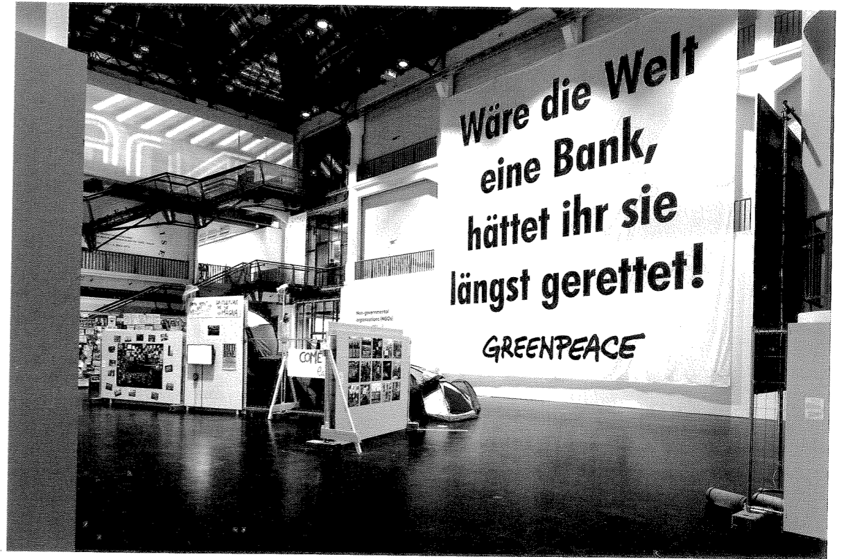
1. Metahaven, Wikileaks, 2011-2013, foto voor de marketing van de merchandise van Wikileaks, 2. Urban-Think Tank, uitzicht vanaf Torre David, 2013, 3. Zaalvezicht global aCtIVISm, ZKM | Museum of Contemporary Art