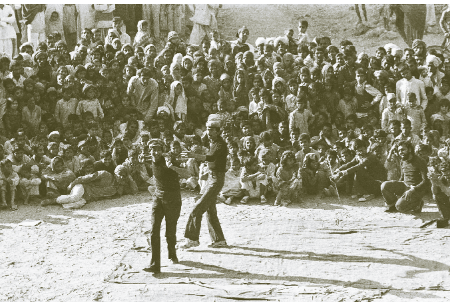
Jana Natya Manch in 1980

Trommels roffelen. Een massa mensen stroomt samen en vormt een kring waarbinnen het theaterspektakel zich afspeelt. Aan de rand van de menigte draven kinderen van hot naar her, zetten straatverkopers snel hun kramen op en fungeren artiesten met aapjes, vogels en goocheltrucs als informele hulp-acts voor de wegdwalers. Toeschouwers verschijnen achter ramen en op daken, om erbij te zijn zonder van huis weg te hoeven.