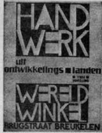
Afische van de Derde Wereldwinkel in Breukelen.