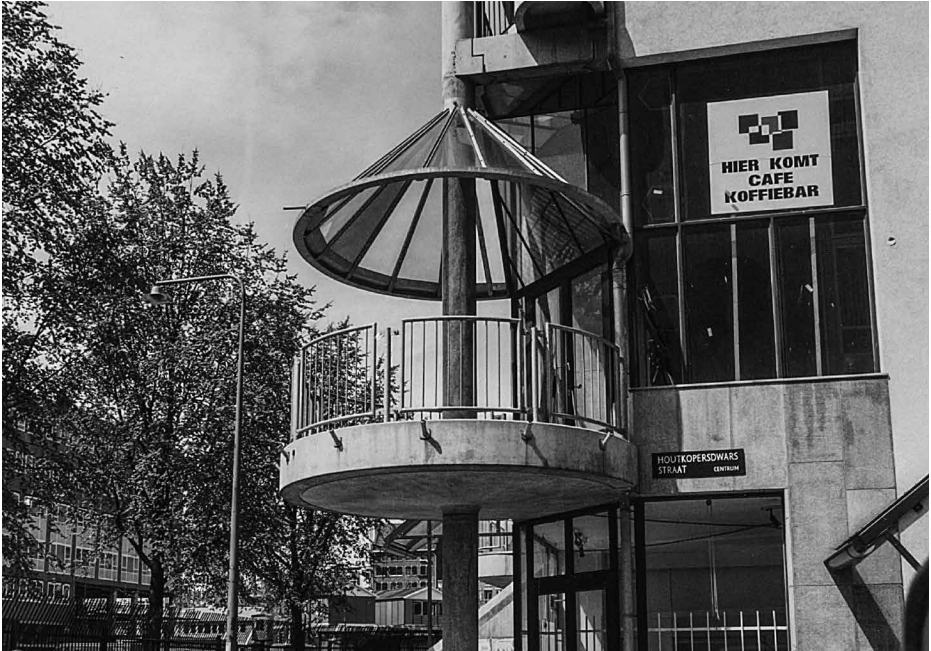
Afb. 7. Het hoekpaviljoen op de hoek van het Waterlooplein, mei 1986.

lagen de meeste reliëf en nadruk krijgen. Aan de kant van de Jodenbreestraat begint de afwisseling tussen open en dicht meteen boven de hoge winkelplint. Na een overgang op de derde verdieping krijgt de hevel daarboven weer meer reliëf, zoals aan het Waterlooplein. Alleen de tweede verticale as vanaf de linkerhoek bereikt acht bouwlagen, de overige assen zeven. Deze hoge as verleent het gebouw nabij de hoek een extra accent. De gevel aan de Houtkopersdwarstraat heeft door de toepassing van een groot aantal dichte wanden het karakter van een zijgevel. Net als aan de kant van het Waterlooplein, kregen de hogere bouwlagen van deze 'zijgevel' een andere behandeling dan de lagere. Het rechterdeel van de gevel, naar de Jodenbreestraat, telt een bouwlaag minder dan het linkerdeel naar het Waterlooplein. Een vergelijkbare opzet met de nodige variatie vertoont het cascogebouw