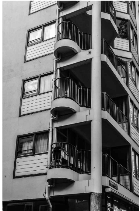
Afb. 3. De hoek Jodenbreestraat en Houtkopersdwarsstraat.