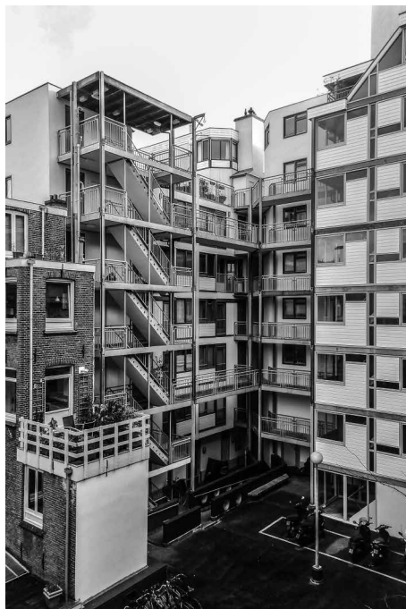
Afb. 8. De binnenplaats gezien naar het noordoosten. Foto auteurs, 2017.

met de woongroep, maar dit bouwdeel is lager.