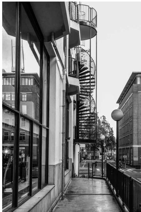
Afb. 5. Galerij langs de winkels/bedrijfsruimten in de Houtkopersdwarsstraat.

zich kenmerkte door een opbouw uit kleinschalige, zich telkens herhalende elementen. Deze ontwerpmethodiek was ontwikkeld door architecten als Aldo van Eyck, Herman Hertzberger en Jan Verhoeven.