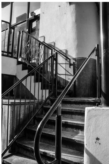
Afb. 4. Opgang in de Houtkopersdwarsstraat op de hoek met de Jodenbreestraat. Foto auteurs, 2017.