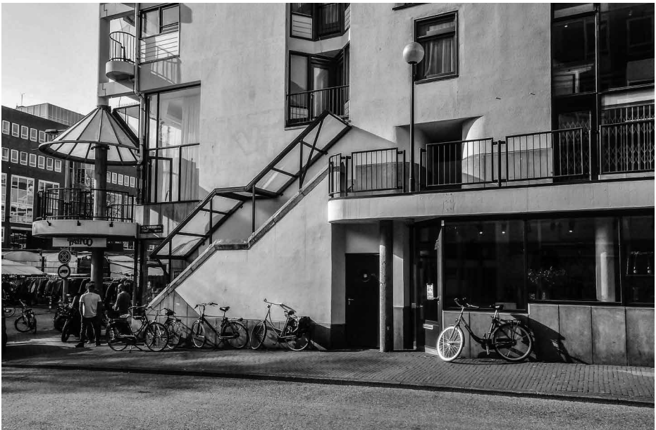
Afb. 6. Hoekpaviljoen en opgang galerij aan de Houtkopersdwaarsstraat. Foto auteurs, 2017.

De verschillende woningtypen stelden Tuijnman in staat te variëren met de opgangen en die als een bijzonder ontwerpelement uit te buiten. Op de binnenplaats gaan de bewoners op naar hun woningen via een mengeling van uitwendige steektrappen en inwendige trappenhuizen, in combinatie met binnen- en buitengalerijen en luchtbruggen. Dit gevarieerde stelsel maakt een tocht door het gebouw tot een ervaring vol verrassingen. Aan de Houtkopersdwaarsstraat hangen aan de buitengevel bovendien twee open spiltrappen die op verschillende hoogten aanvangen en eindigen. Beneden loopt hier ook een gaanderij langs de winkels, die zich vanwege het aanwezige talud boven het straatniveau bevinden. Het ronde, uitstekende paviljoen met de glazen overkapping, laaghangend op de hoek van het Waterlooplein met de Houtkopersdwaarsstraat, hoort bij de winkel op de hoek. De opgangen aan weerszijden vertonen eveneens een glazen overkapping. De speelse