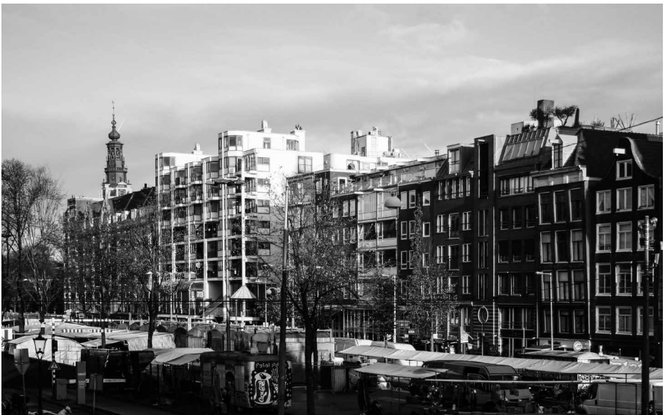
Afb. 10 Gran Vista in de noordelijke pleinwand van het Waterlooplein.

In het kader van de aanwijzingen tot monument 'post 1965' komt dit complex in de oorspronkelijke staat zeker aanmerking voor een aanwijzing tot gemeentelijk monument. Het is spijtig dat het Cuypersgenootschap niet eerder in kennis is gesteld van de dreigende aantasting, want we hadden ons zeker ingezet voor behoud van de bestaande karakteristieken. De bouwvergunning is helaas al onherroepelijk. Het is afwachten of het complex na de geplande ingrepen nog steeds voor een monumentenstatus in aanmerking komt.