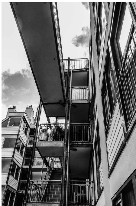
Afb. 9. Trappen gezien naar het oosten. Foto auteurs, 2017.

Zowel aan de straat als op de binnenplaats trekken bijzondere details de aandacht. Een bijzondere vorm kregen de twee buitenhoeken in het gebouw aan weerszijden van de Houtkopersdwaarsstraat. Op beide opengewerkte hoeken staat een ronde kolom, die doorloopt van onder tot boven. Ze steunen de balkons. Aan de Jodenbreestraat zijn dit driehoekige, naar voren stekende balkons, aan het Waterlooplein blijven de balkons achter het gevelvlak. Aan de kant van de Houtkopersdwaarsstraat hebben deze balkons een kleine, halfronde uitstulping, die bewoners in staat stellen deze straat in te kijken. Deze halfronde vormen corresponderen met die in de veel