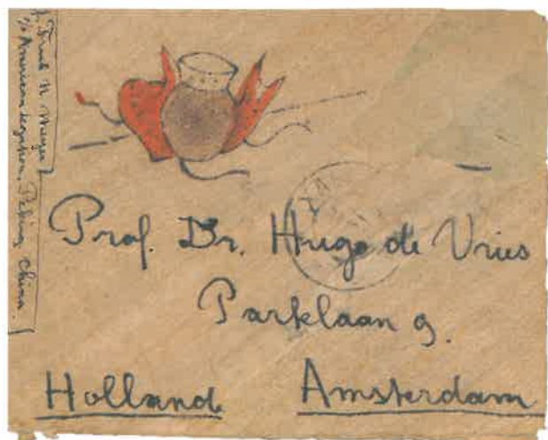
Versierde envelop van een brief van Meijer aan De Vries. Collectie Hugo de Vries, Artis Bibliotheek-Bijzondere Collecties van de UvA.