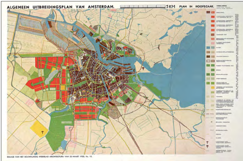
Figuur 1: Algemeen Uitbreidingsplan van Amsterdam.

De stap van het Algemeen Uitbreidingsplan naar het nu en de decennia die voor ons liggen, is ogenschijnlijk een grote: de opgaven zijn veranderd en de maatschappelijke context ook. Het bouwen op opgespoten stukken land aan de rand van de stad – zeg maar de tabula rasa-benadering van de generatie van Van Eesteren en Van Lohuizen – komt in grootstedelijke gebieden nauwelijks meer voor. Het werkveld van de lokale planologische professional bestaat tegenwoordig uit te herstructureren bedrijventerreinen en verdichtingsopgaven in bestaande woonwijken – vaak gebouwd in de tijd vlak na de oorlog. Dit zijn ingewikkelde transformatielocaties waar de belangen van huidige en toekomstige bewoners, nieuwe generaties, ondernemers en vastgoedeigenaren om voorrang strijden. Hier opereert de lokale planologische professional in een interactieve, complexe en vaak conflictueuze setting van politieke sturing, burgerbetrokkenheid en marktlogica. Dit vergt op gebiedsniveau kennis van de geschiedenis, van de cultuur van bewoners en gebruikers, van hoe zij op deze plekken samenleven. 14