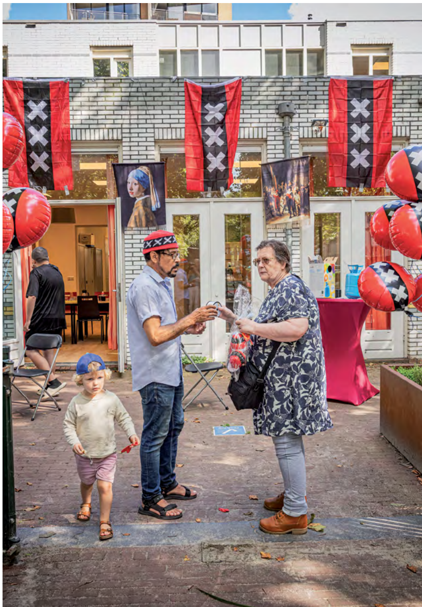
Figuur 2: Samenleven in verschil