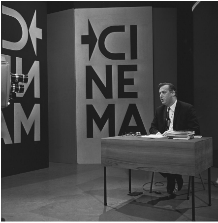
Jan Blokker als presentator in het televisieprogramma CINEMA in 1967.

Alleen al Blokkers betekenis voor de Nederlandse filmwereld zou een aparte studie rechtvaardigen, maar hier zal worden volstaan met een beschouwing van zijn betekenis voor de journalistiek en de televisie.