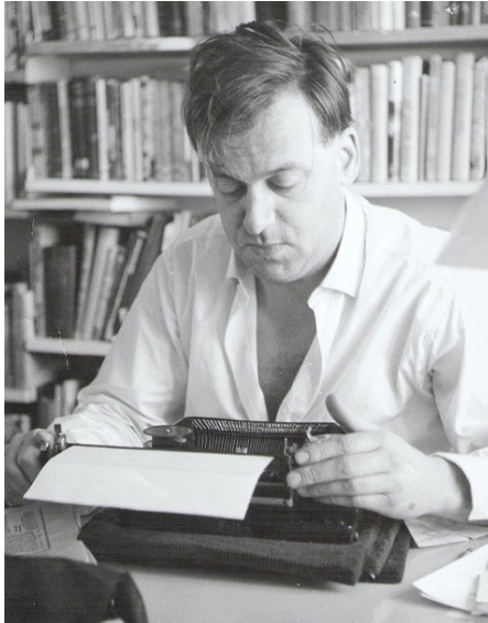
Jan Blokker als filmredacteur voor het Algemeen Handelsblad, 1964

Op dat karikaturale beeld baseerde Blokker zijn opvatting dat journalisten zich niet zouden moeten verenigen. Deden ze dat wel dan zouden allesbedekkende kongsi's in de achterkamertjes van de macht ontstaan die hadden geleid tot de zwijgzaamheid van journalisten in bijvoorbeeld de Hofmans-affaire van 1956. Blokker liet zich bij voorkeur dan ook niet zien in de journalistieke beroepsorganisatie, hooguit om de leden daarvan af en toe bestraffend en belerend toe te spreken als men zich weer eens te nadrukkelijk had laten fêteren door autoriteiten of zich teveel had ingelaten met de 'flauwekul' van vakbondsactiviteit in plaats van 'loeren, vragen stellen en ladders tegen ramen plaatsen'. Hij vond dat 'stokers van de locomotief, bestemd tot het aanvoeren van nieuwstijdningen' iets beters te doen hadden dan met elkaar het vak koesteren: 'Gij zult nieuws garen, gij zult daarbij afzijdig blijven, gij zult u in de werktijd niet met concurrenten verenigen, gij zult u nimmer door uw bronnen laten fêteren'. 26 Journalistiek moest altijd een individuele uiting zijn, een vorm van burgerschap waarin het gezonde verstand en geestelijke onafhankelijkheid het uiteindelijk altijd zouden winnen.