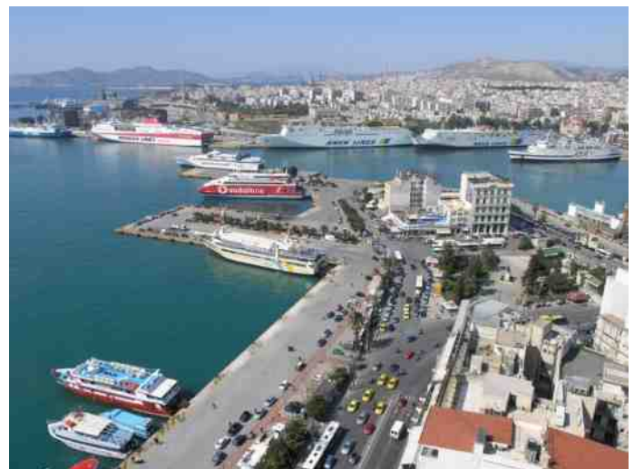
Peking is van plan de haven van Piraeus te verbinden met Belgrado en Boedapest via een hoge snelheidsverbinding.