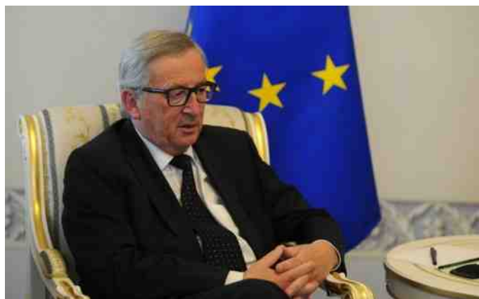
Jean-Claude Juncker heeft een aantal Balkanlanden het EU-lidmaatschap in het verschiet gesteld.

Hoewel Kosovo nu al meer dan tien jaar onafhankelijk is, is de officiële erkenning van het land nog steeds niet geregeld. Het was te verwachten dat Servië van mening is dat de afscheiding van de landsstreek Kosovo illegaal is en dat het land op alle mogelijke manieren zal proberen de Europese integratie van de jonge Albanese staat, die in het noorden een grote Servische minderheid huisvest, tegen te werken. De Europese Unie heeft de Serven en Kosovo-Albanezen meermaals laten weten dat beide landen niet op een lidmaatschap hoeven te rekenen als zij hun onderlinge conflictstof niet bijleggen. Maar interessant in dit geval is dat de erkenning van Kosovo niet alleen voor conflictstof op de Balkan zorgt maar juist voor interne tegenstellingen in de Unie zelf. Er zijn nog steeds vijf EU-lidstaten die weigeren om Kosovo te erkennen. Cyprus, Griekenland, Roemenië, Slowakije en Spanje zijn bevreesd dat van de erkenning van Kosovo door de belangrijkste Westerse staten een precedentwerking zal uitgaan als oplossing voor problemen die deze staten met eigen onwillige regio's hebben. In het geval van de Catalaanse crisis veroorzaakt door het onafhankelijkheidsstreven van separatisten onder leiding van de afgezette regionale president Puigdemont viel