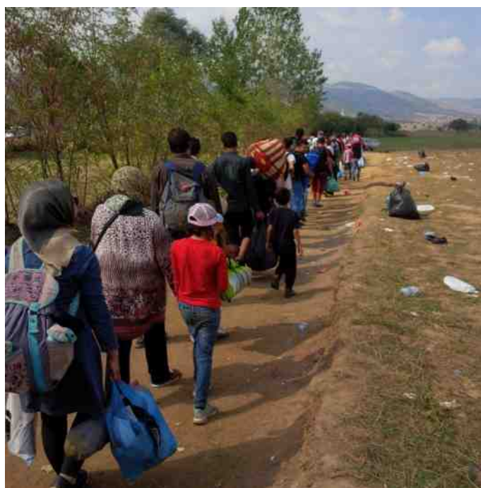
Op het hoogtepunt van de migratiecrisis in 2015 kregen landen aan de Balkanroute zware kritiek uit Brussel