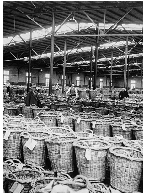
Afb. 2. Het interieur van de hal uit 1930 kort na de opening.

Na de oorlog kwam de bloembollenproductie weer snel op peil en maakte deze herstel en een verdere groei door. In 1964 verzezen achter de tweelinghal uit 1928 een grote hal en twee kleinere met gebogen daken, waardoor de ruimte nog eens aanzienlijk uitbreidde. In het begin van de jaren zestig vond er nauwelijks aanvoer per schuit meer plaats. De vaart voor de loodsen uit 1928 en 1930 ging daarom eind jaren vijftig dicht. In 1977 verzezen er enorme koel- en draagcellen aan de achterzijde van het terrein, een iriskokerij en een kantine. 24 Het veilingbedrijf ging uiteindelijk op in de Coöperatieve Nederlandse Bloembollencentrale (CNB). Binnen dit bedrijf maakten veilingen plaats voor andere vormen van bemiddeling. Het bedrijf in Bovenkarspel biedt vooral verwerking en geconditioneerde opslag van bollen en biedt