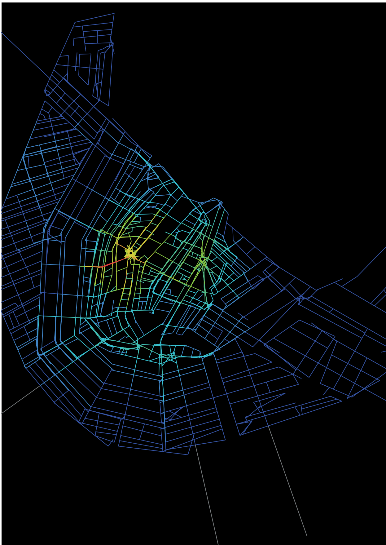
5. Toegankelijkheid binnen het stratennetwerk van Amsterdam, circa 1700 (kaart auteur)