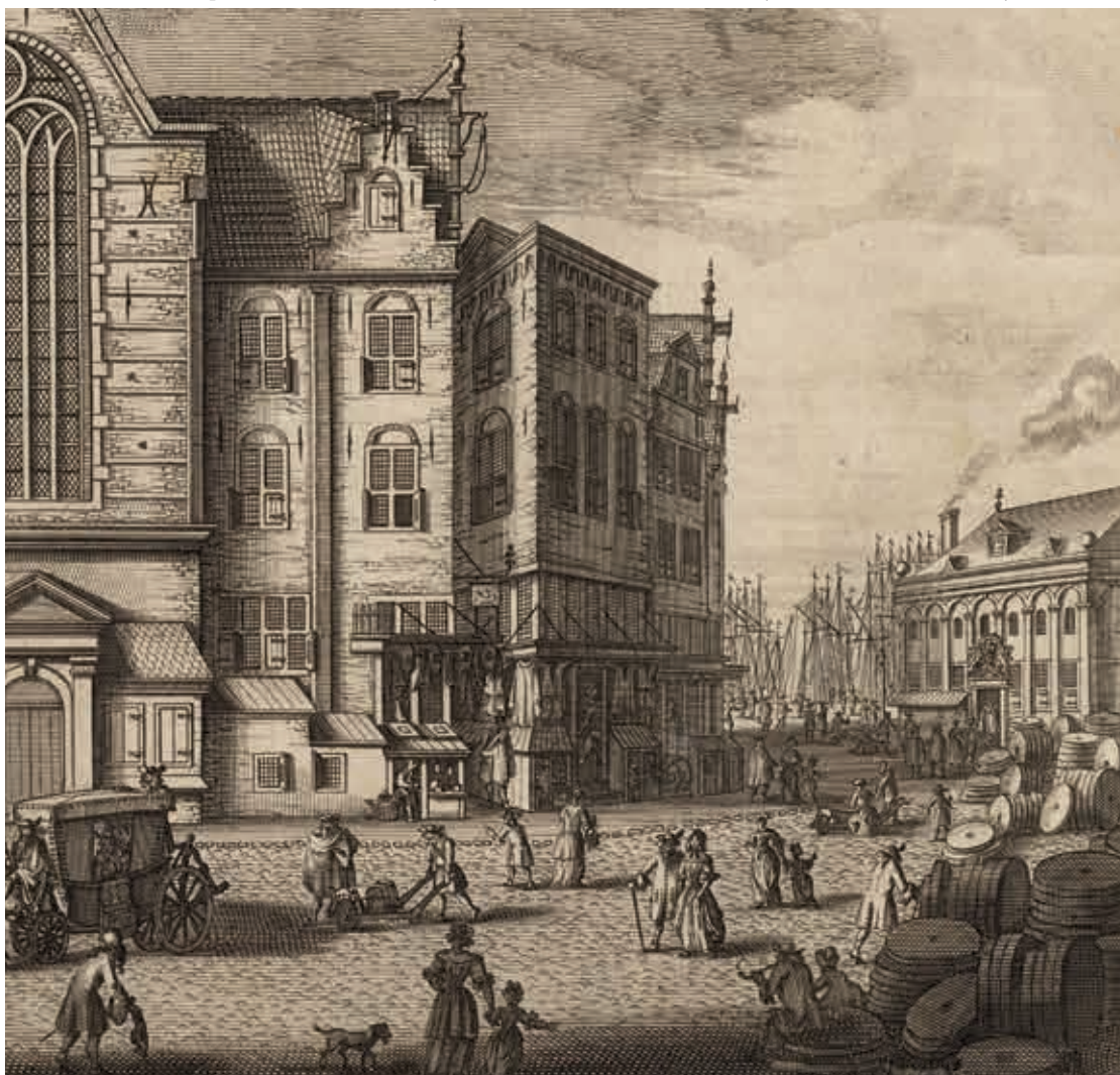
8. Winkels en winkelpothuizen aan de Zeedijk, tweede helft zeventiende eeuw