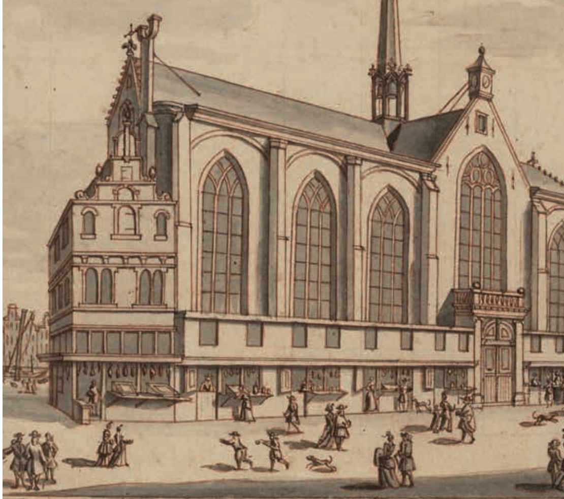
7. Winkeluitstallingen in de Kalverstraat bij de Nieuwezijdskapel, circa 1700