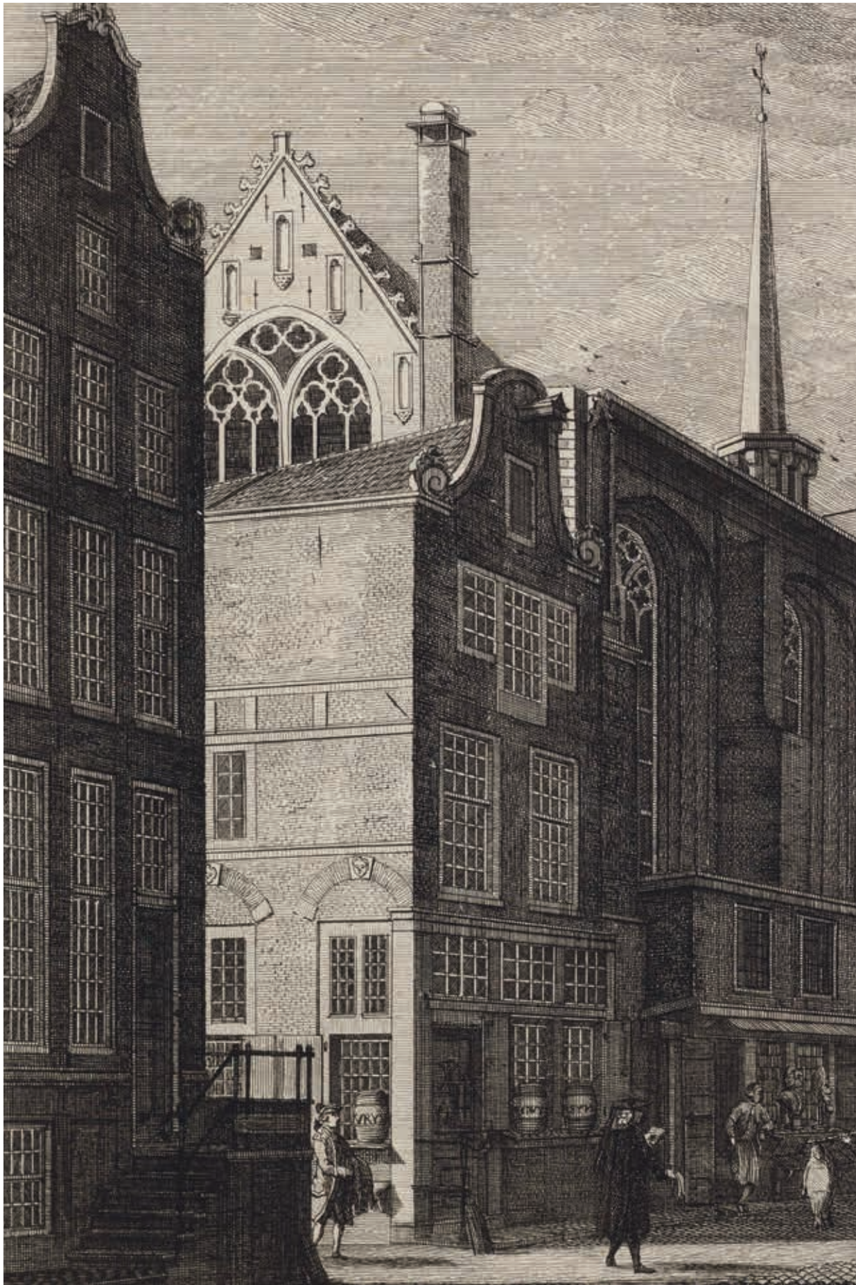
11. Winkelpand in Kalverstraat, tweede helft achttiende eeuw (Stadsarchief Amsterdam)