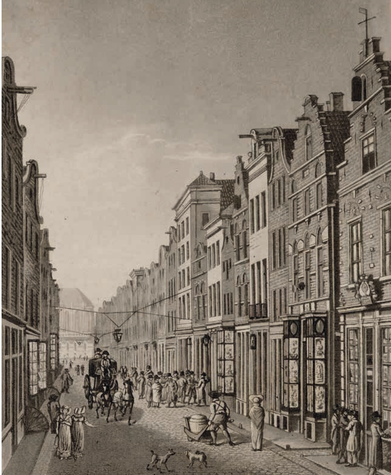
13. De Kalverstraat bij de Dam, 1825

Enkele decennia later waren in dit deel van de Kalverstraat de uitgebouwde etalagekasten weer verdwenen en de in roeden gevatte ruiten waren er opnieuw groter dan voorheen. Evenals veel topgevels werden toen ook de onderpuien met een lijst afgesloten (afb. 14).