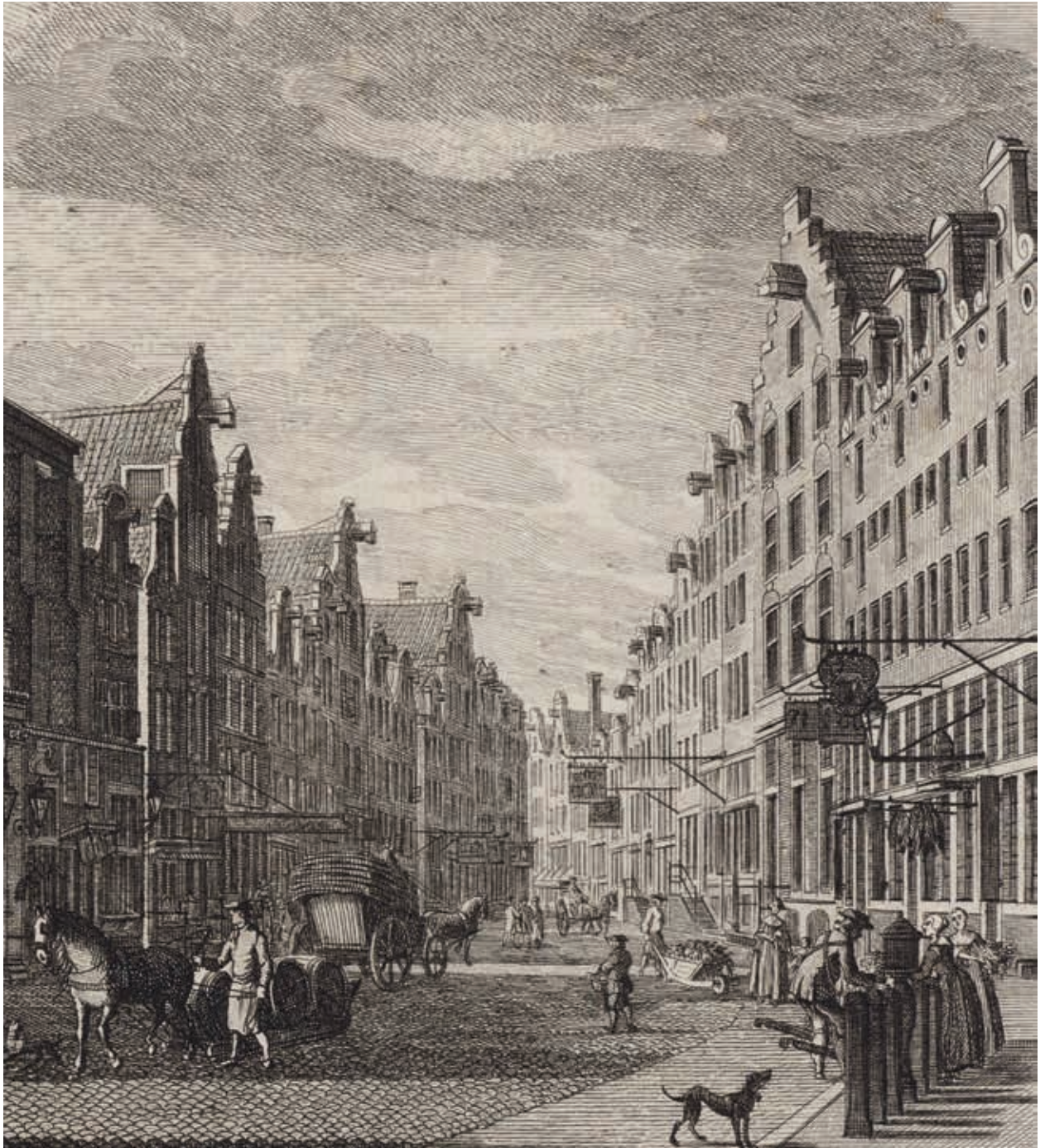
12. De Kalverstraat in de tweede helft van de achttiende eeuw

vergroten van het glasoppervlak, verwijderen van de luifel en opruimen van pothuizen en andere bouwsels waren pogingen dit te bewerkstelligen, en sommige winkeliers vervingen tevens de houten deuren door glasdeuren. Uiteindelijk leidden al deze aanpassingen tot de ontwikkeling van een specifiek op de detailhandel afgestemde onderpui. Afgaande op bouwtekeningen en afbeeldingen kwam deze 'emancipatie' van de winkelpui tot uitdrukking in maximalisering van de hoeveelheid glas en het accentueren van de ingangspartij. Dat laatste gebeurt vaak door het centraal in de gevel plaatsen van de ingang, door toevoeging van architecturale en decoratieve accenten en ook door