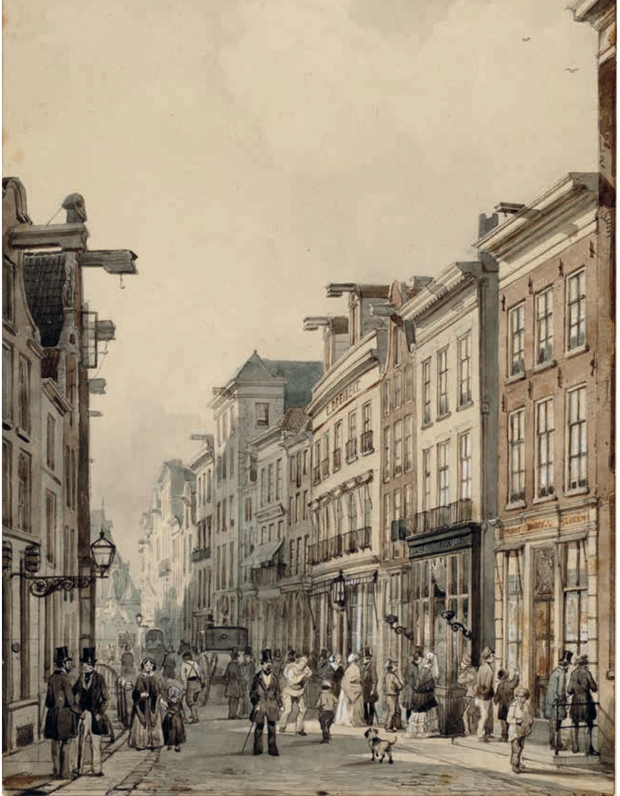
14. De Kalverstraat bij de Dam, 1850

verlichtingselementen werden opgetekend dan in de zeventiende eeuw. In de meeste gevallen ging het daarbij om blakers, lage schotelvormige kandelaars geschikt voor het branden van kaarsen. In de schemering en avonduren leverden ze een bijdrage aan de verlichting van de winkel, maar de lichtopbrengst was heel gering en buiten het directe bereik van het kaarslicht moet het aardedonker zijn geweest. 26