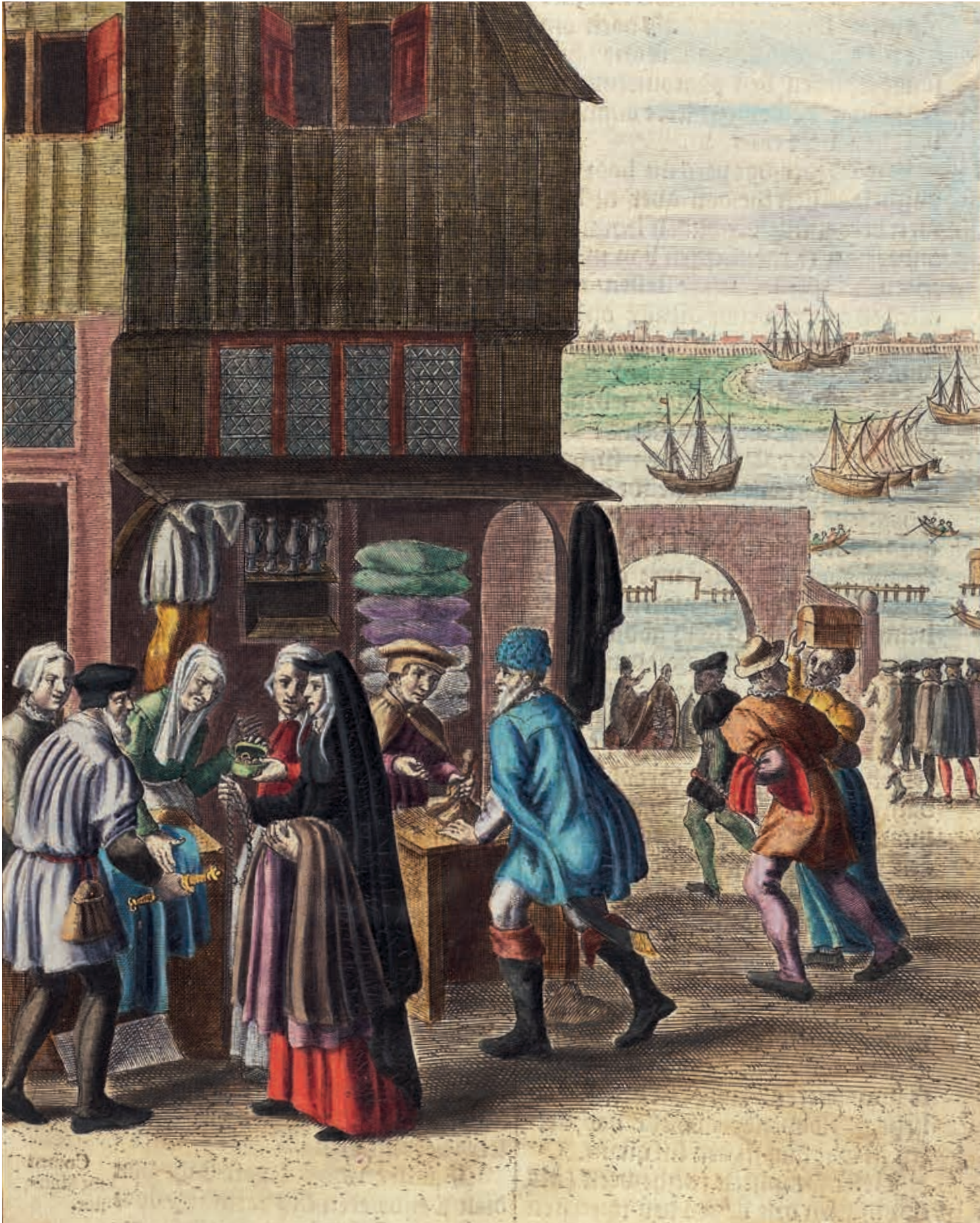
6. Wederdopers bij een Amsterdamse uitdragerij, zestiende eeuw