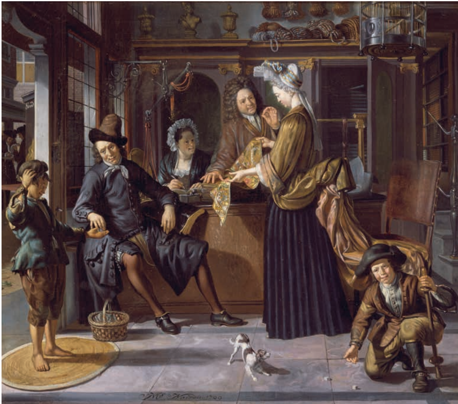
10. Interieur van een goudbrokaatwinkel, 1709

de jaren veertig treffen we soms in een winkelvoorhuis een bedstede en beddengoed aan. Bijvoorbeeld in het huis van Franchoy van Bercken, neurenbergier in de Oudebrugsteeg. Dit huis stond tot de nok volgestouwd met koopwaar en vooral in het voorhuis moet er geen doorkomen aan zijn geweest. Toch werden in dit voorhuis naast alle goederen ook een bed (i.e. matras), twee kussens, een peluwe (langwerpig onderkussen), drie dekens en twee lakens aangetroffen en was er kennelijk een bedstede aanwezig en in gebruik. 20