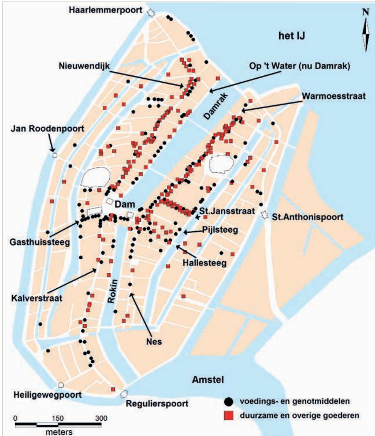
2. Winkellocaties in Amsterdam, 1585 (kaart auteur)

in, want op de bovenverdieping, die men met brede stenen trappen kon bereiken, bevond zich rondom een galerij met niet minder dan 123 winkelkassen. Buiten, op straatniveau in gemetselde bogen langs de zijgevels van de beurs en aan weerszijden van de ingang, bevonden zich ook winkels. 7 Het winkelbedrijf was dus prominent aanwezig op en rondom de Dam. Ook op de Nieuwendijk waren winkels in overvloed, maar de belangrijkste winkelstraat was in deze jaren de Warmoesstraat. Dit was de plaats waar kostbare stoffen, luxe voorwerpen en modeartikelen naar Franse smaak