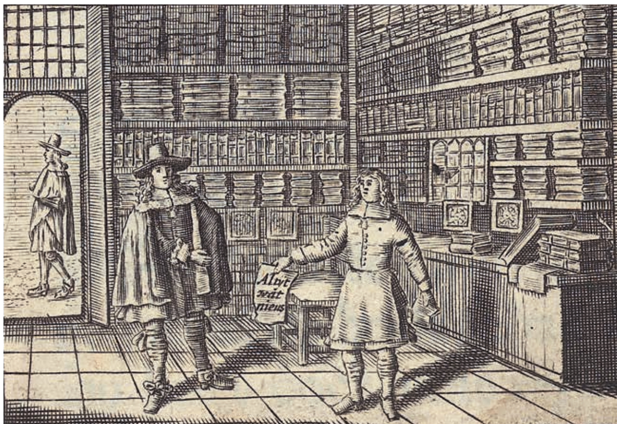
9. Interieur van een boekwinkel, circa 1661 (Bijzondere Collecties, UvA)

In de zeventiende eeuw was de scheiding tussen winkel en privévertrekken nog niet overal doorgevoerd. In