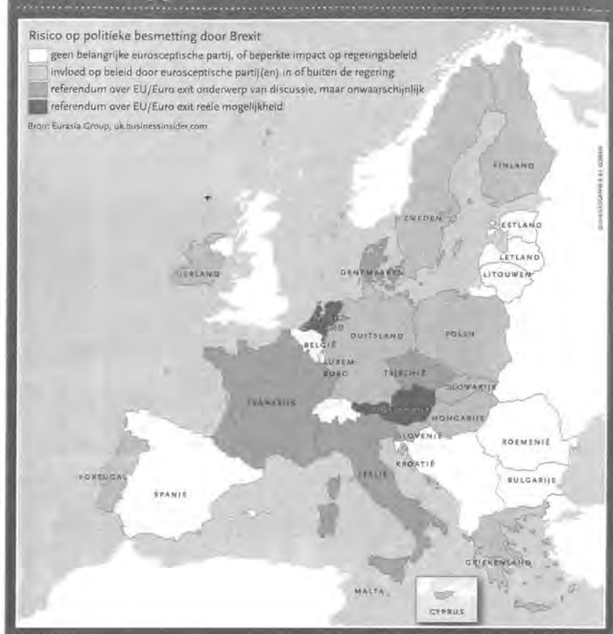
Figuur 3: 'Besmettingsgevaar' Brexit

gedachtevorming over mogelijke verdere consequenties van de Brexit (gaat de City of London dit overleven; gaan financiële instellingen vertrekken) was een nieuw argument dat Nederland vanwege zijn eurosceptische reputatie misschien toch een minder voor de hand liggend toevluchtsoord zou zijn. En zo vervolgde de boodschap van het kaartje zijn weg.