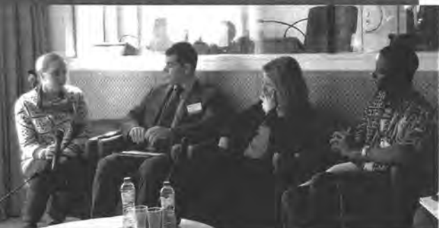
Promotiefilmje over de Global Strategy, dat allerlei aspecten aanstipt van het buitenlands EU-beleid: zoals vluchtelingen, klimaat, onderwijs, ontwikkelingssamenwerking, naast defensie en intelligence . Ook de brede raadpleging onder (jonge) mensen komt aan de orde. Mogherini: 'Today, foreign policy is not just about diplomats, it's about everybody.' – http://europa.eu/globalstrategy/

geloof in eigen kunnen was verpieterd. De slechte samenwerking tussen de EU en de afzonderlijke lidstaten, tussen de lidstaten onderling en tussen de onderdelen van de EU werd als zeer problematisch ervaren. De ambitie was dus niet alleen een visie waarin alle lidstaten zich konden herkennen, maar een echte leidraad voor gezamenlijk en effectief optreden op het wereldtoneel.