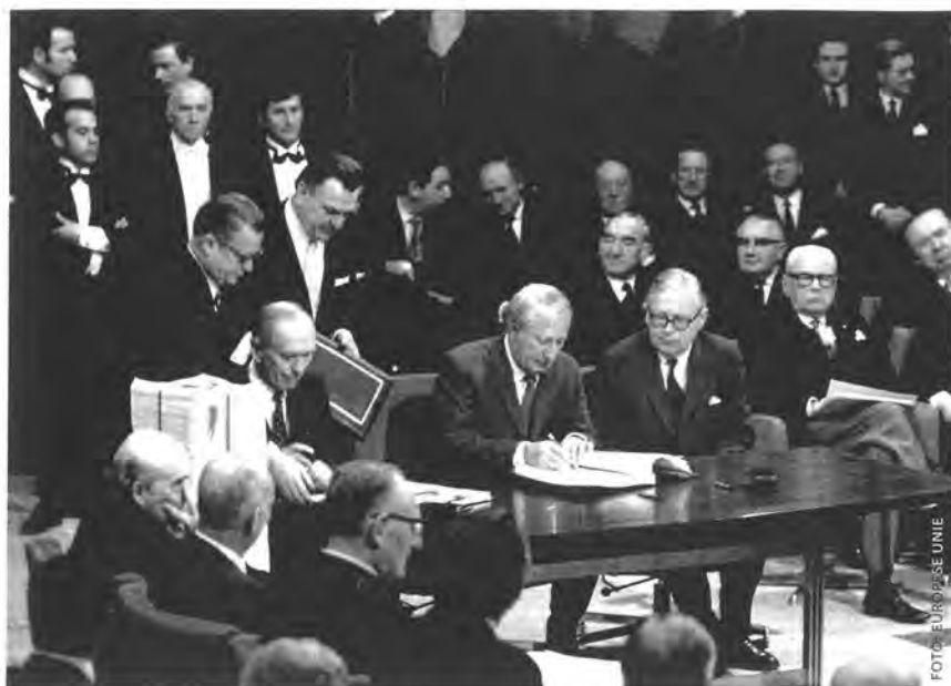
De Britse premier Edward Heath ondertekent het verdrag voor lidmaatschap van de EEG in januari 1973, met links sir Alec Douglas-Home, staatssecretaris van Buitenlandse Zaken en het Gemenebest, en rechts Geoffrey Rippon, die de onderhandeling voor toetreding tot de EEG leidde.

voelden de Britten zich 'geleefd' door Brussel. De mobiliteit binnen de EU was een belangrijk pijnpunt. Bij de grote uitbreiding in 2004 van 15 naar 25 lidstaten was het VK juist een van de toegankelijkste landen. Anders dan Nederland stelde het VK geen transitieperiode in, en zo kregen burgers van de nieuwe lidstaten meteen de vrijheid om werk te zoeken in het VK.