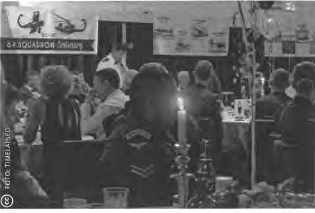
Wat gebeurt er met de Britse legerbases in Akrotiri en Dhekelia op Cyprus en de Britse community aldaar, na de Brexit?

laaide het conflict weer op tussen Republikeinen die bij de Ierse Republiek willen, en Unionisten die bij het VK willen blijven. In 1998 zijn de Goede Vrijdagakkoorden getekend, waarin Noord-Ierland meer autonomie heeft gekregen, en Ierland samen met het VK waakt over goed bestuur in de regio. Alle afspraken berusten op het feit dat beide landen lid zijn van de EU. De gedeelde soevereiniteit gaat voornamelijk over de vertaling van EU-richtlijnen in de Noord-Ierse wetgeving. De noodzaak daartoe verdwijnt zodra Noord-Ierland en de rest van het VK geen lid meer zijn. Ook is er de kwestie van de open grens tussen Ierland en Noord-Ierland die dicht zou moeten, en over het Ierse en EU-burgerschap van Noord-Ieren.