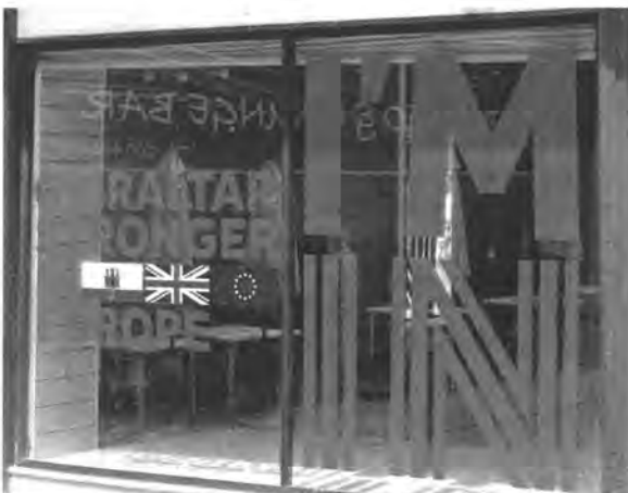
De bewoners van Gibraltar willen Brit blijven, maar hebben ook massaal voor 'Remain' gestemd.

Hoe de alchemisten voor beide unies een gulden toekomst uit het scheidingsproces gaan toveren, is vooralsnog een raadsel. Na de onverwachte Britse verkiezingen gaat het onderhandelingspel beginnen. Verdere verrassingen niet uitgesloten. •