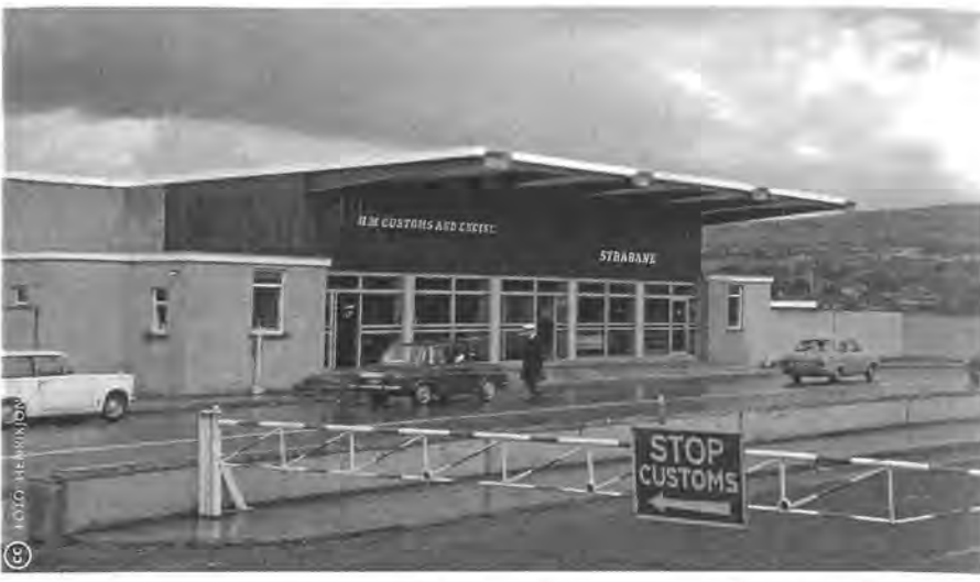
Keren grensposten zoals deze in Strabane (1968) tussen Noord-Ierland en Ierland terug?

Drie lidstaten maken zich zorgen over de gevolgen van de Brexit voor hun eigen voortbestaan: Ierland, Cyprus en Spanje. Bij Ierland gaat het om de arrangementen rond Noord-Ierland, dat zowel door Ierland als door het VK wordt geclaimd. Na 1968