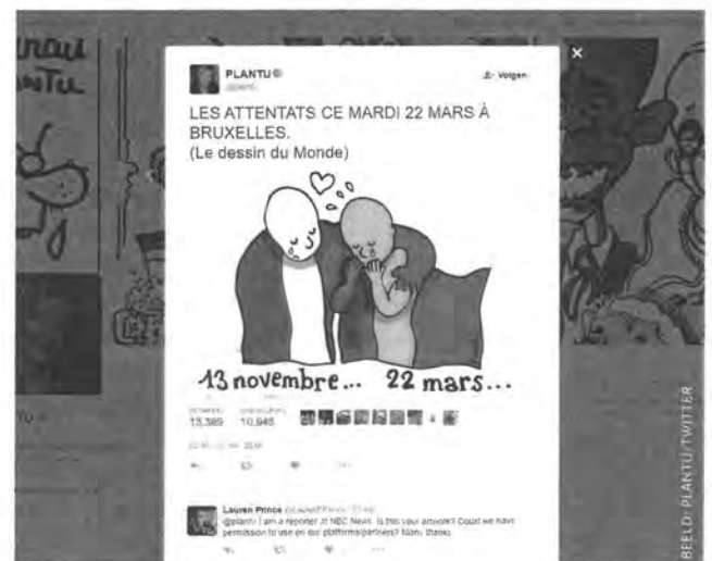
Tweet van Plantu met zijn cartoon uit le Monde over het bezoek van de burgemeester van Parijs, Anne Hidalgo, aan Brussel, met nationale symbolen voor interstedelijke solidariteitsbetuiging.