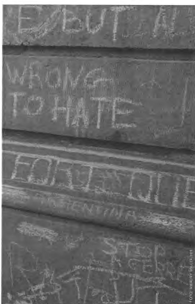
Honderden mensen delen de dag na de aanslagen hun verdriet op het Brusselse Beursplein.

Brussel-Halle-Vilvoorde (BHV) vanwege de zich wijzigende verhoudingen tussen de taalgroepen stond tussen 2002 en 2012 bovenaan de Belgische politieke agenda. Als er net zo veel politieke energie in de problemen van de achterstandswijken was gestoken, had het er nu anders uit gezien, klonk het.