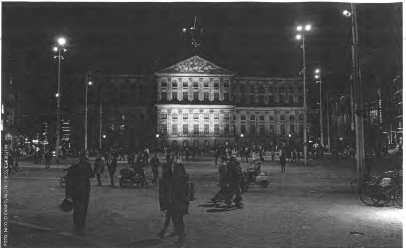
Als teken van solidariteit was onder andere het Paleis op de Dam in Amsterdam verlicht in de Belgische driekleur.

Over de hele wereld werden gebouwen in het licht gezet met verticale banen zwart, geel, rood