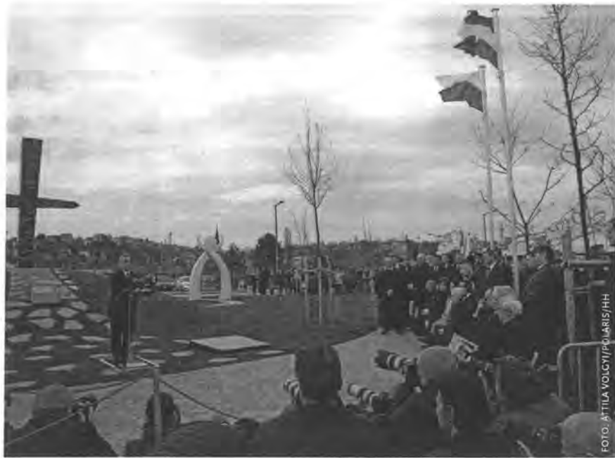
De Hongaarse premier Viktor Orbán tijdens de onthulling van een 'monument voor Smolensk' in Boedapest, ter nagedachtenis van de slachtoffers van de vliegtuigramp in 2010 in Smolensk/Rusland, waarbij de Poolse president Lech Kaczyński, diens vrouw en 94 leden van een Poolse delegatie om het leven kwamen. Rechts tussen de genodigden zit Jarosław Kaczyński.

Voor Hongarije stuurt hij aan op een eigen soort democratie.