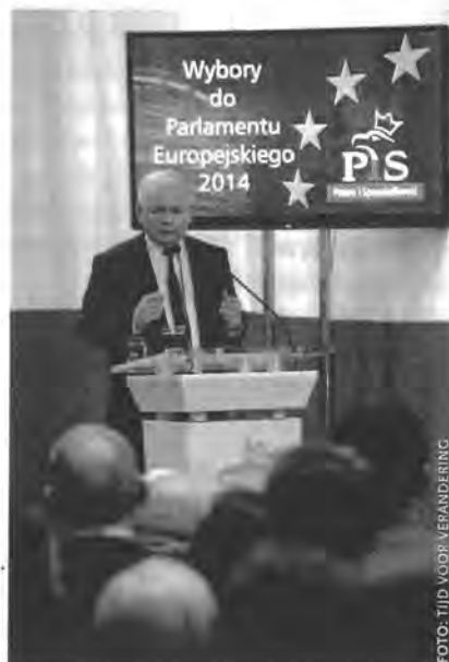
Foto onder: Jarosław Kaczyński presenteert de lijsten met PiS-kandidaten aan het Europees Parlement (maart 2014).

Afgelopen december zette verantwoordelijk commissaris Frans Timmermans de zware, nooit eerder gebruikte artikel 7-procedure in werking, waarbij Polen uiteindelijk zelfs het stemrecht in de Europese Raad zou kunnen verliezen. 'Zou kunnen', want daarvoor is uiteindelijk