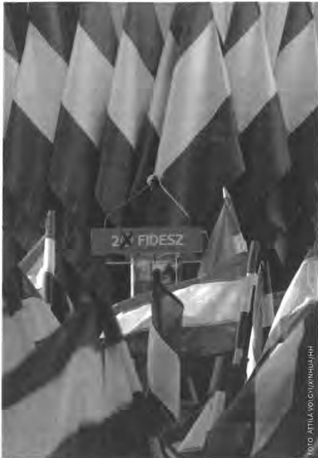
Viktor Orbán op de laatste rally voor zijn partij Fidesz in Székesfehérvár, twee dagen voor de verkiezingen (6 april 2018).

grootmachten vervormde, afgeschafte, weer opgerichte en geografisch verschoven staat, en kent een lang, soms gespannen verleden met een zeer omvangrijke Joodse gemeenschap, die daar in de Tweede Wereldoorlog vernietigd is, waardoor het land etnisch zeer homogeen werd. Hongarije is overheerst door buiten-Europese rijken, ontwikkelde zich tot tweede natie binnen de Habsburgse Dubbelmonarchie en ten slotte tot een door het buitenland bepaalde, relatief krap uitgevallen staat met omvangrijke etnische Hongaren die als minderheden bij de burens achterbleven.