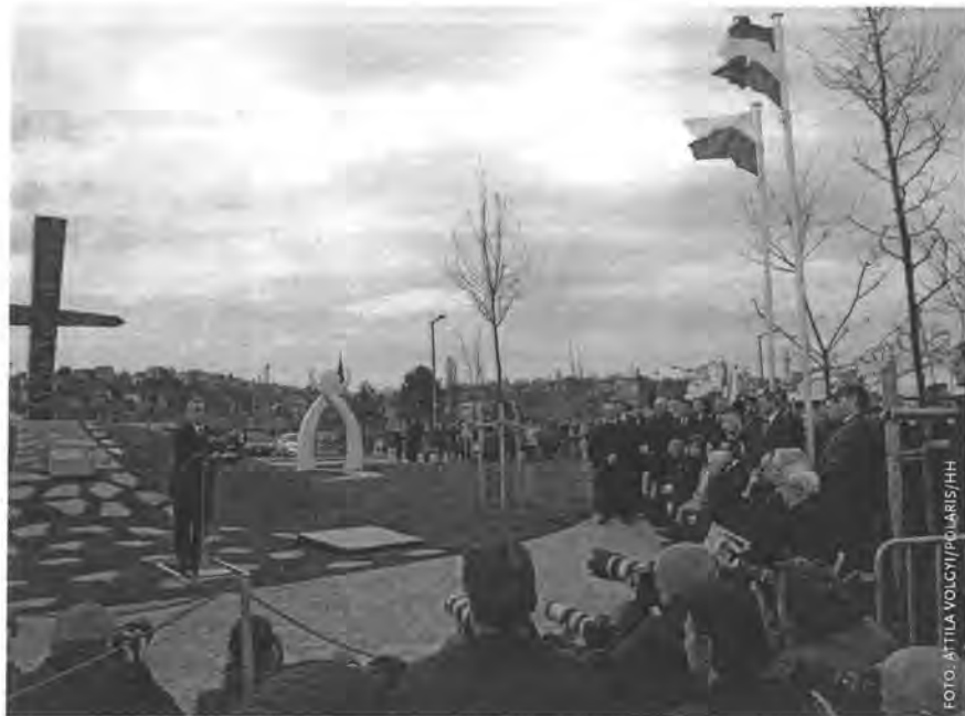
De Hongaarse premier Viktor Orbán tijdens de onthulling van een 'monument voor Smolensk' in Boedapest, ter nagedachtenis van de slachtoffers van de vliegtuigramp in 2010 in Smolensk/Rusland, waarbij de Poolse president Lech Kaczyński, diens vrouw en 94 leden van een Poolse delegatie om het leven kwamen. Rechts tussen de genodigden zit Jarosław Kaczyński.

Voor Hongarije stuurt hij aan op een eigen soort democratie.