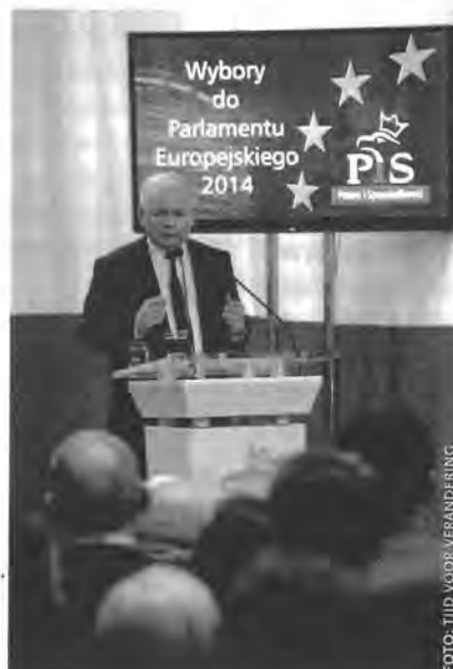
Foto onder: Jarosław Kaczyński presenteert de lijsten met PiS-kandidaten aan het Europees Parlement (maart 2014).

Afgelopen december zette verantwoordelijk commissaris Frans Timmermans de zware, nooit eerder gebruikte artikel 7-procedure in werking, waarbij Polen uiteindelijk zelfs het stemrecht in de Europese Raad zou kunnen verliezen. 'Zou kunnen', want daarvoor is uiteindelijk