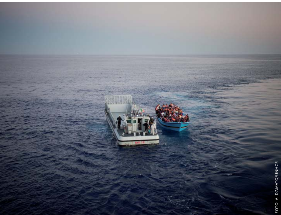
Onder invloed van de conflicten in Libië, Oekraïne, Syrië en in 2014 ook Eritrea neemt het aandeel asielzoekers in de migrantenstroom naar Europa snel toe (tot bijna 50% in 2014). Op de foto redt de Italiaanse marine een groep migranten uit Noord-Afrika van een overvol bootje zonder voorzieningen op de Middellandse Zee, 28 juni 2014.

In Oekraïne en Libië, maar ook elders, is het Nabuurschapsbeleid tot dusverre geen succes. De nabuurlanden delen niet in de geneugten van de EU; daarvoor is het lidmaatschap van de kennissenkring niet toereikend. Het is zelfs omstreden en werkt in Oekraïne mogelijk contraproductief. In Libië zijn de omstandigheden te chaotisch om met de implementatie van het beleid een echt begin te maken.