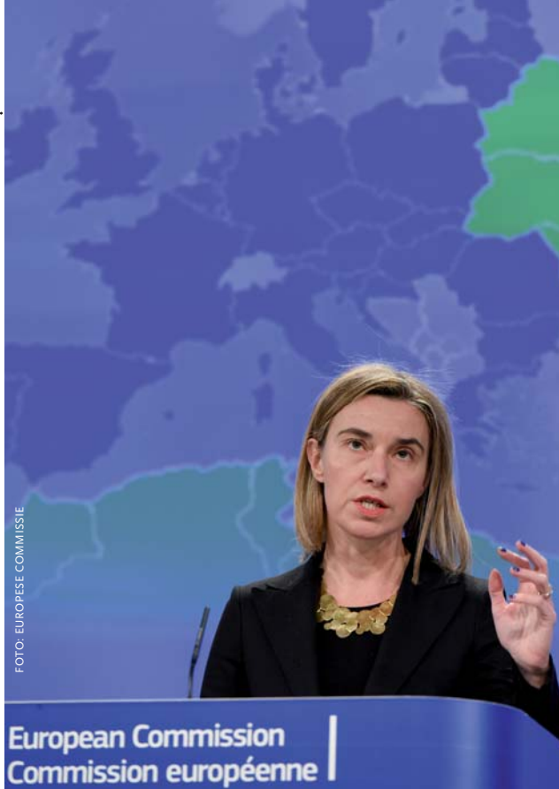
Federica Mogherini, Hoge vertegenwoordiger voor buitenlandse zaken en veiligheidsbeleid, lanceerde op 4 maart samen met Johannes Hahn, Europees commissaris voor Europees Nabuurschapsbeleid en uitbreidingsonderhandelingen, een raadpleging over de toekomst van het Europees Nabuurschapsbeleid.

een van elders aangetrokken bevolking van arbeiders en expats. De officiële hoofdstad Tripoli in het westen strijdt om de macht met verscheidene plaatsen (vooral Benghazi) in het oosten.