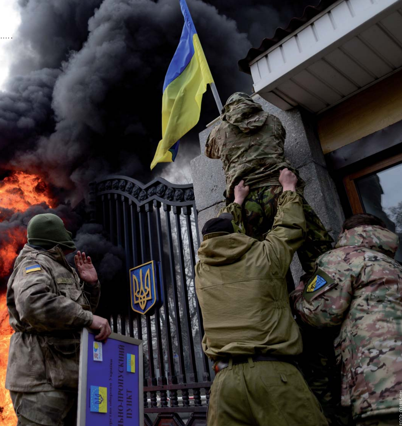
Oekraïne, een van de brandhaarden in de 'ring van vuur' rond de EU. Op de foto: reservisten van het Aydar-bataljon redden de Oekraïense vlag uit de vlammen van in brand gestoken autobanden voor het Ministerie van Defensie in Kiev.