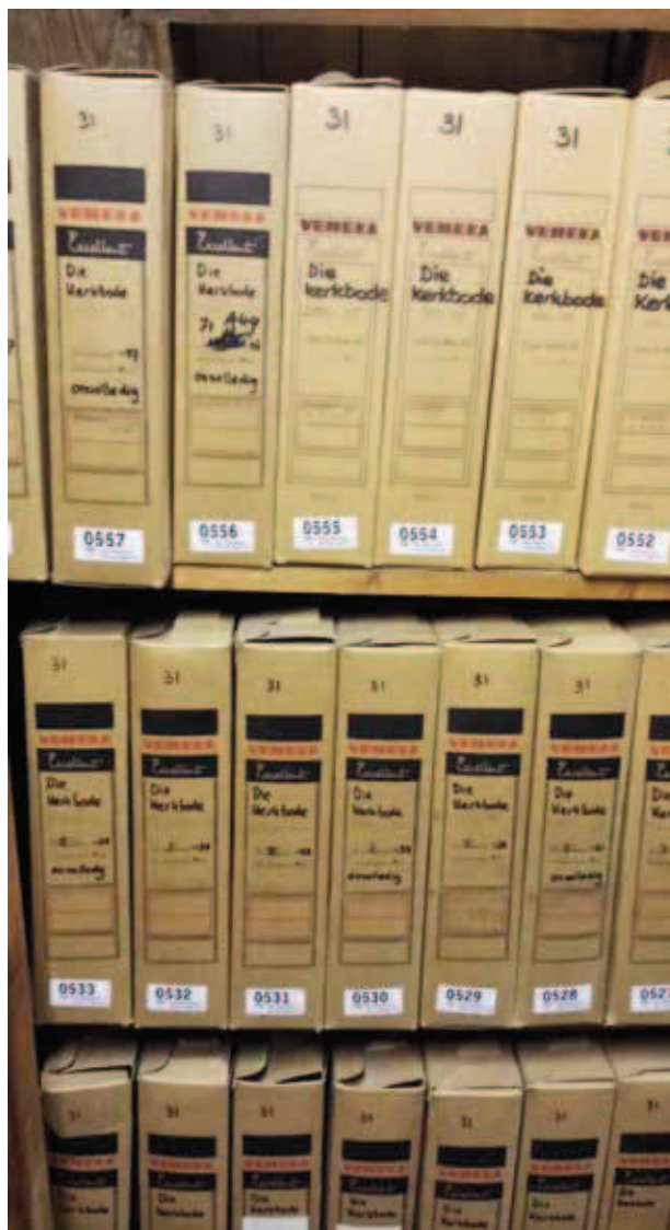
Klaar voor de verhuizing.

De persoonlijke archievencollecties geven vergelijkbare inkijkjes. Het persoonlijk archief van H. Emous, een schoolhoofd uit Amsterdam dat actief onderwijzers wierf, bevat veel brieven van Nederlandse onderwijzers die met name in de jaren 90 van de negentiende eeuw naar Zuid-Afrika vertrokken. Deze onderwijzers vertellen zeer uitgebreid over het opzetten van scholen in een klimaat dat niet altijd vriendelijk is (de beruchte