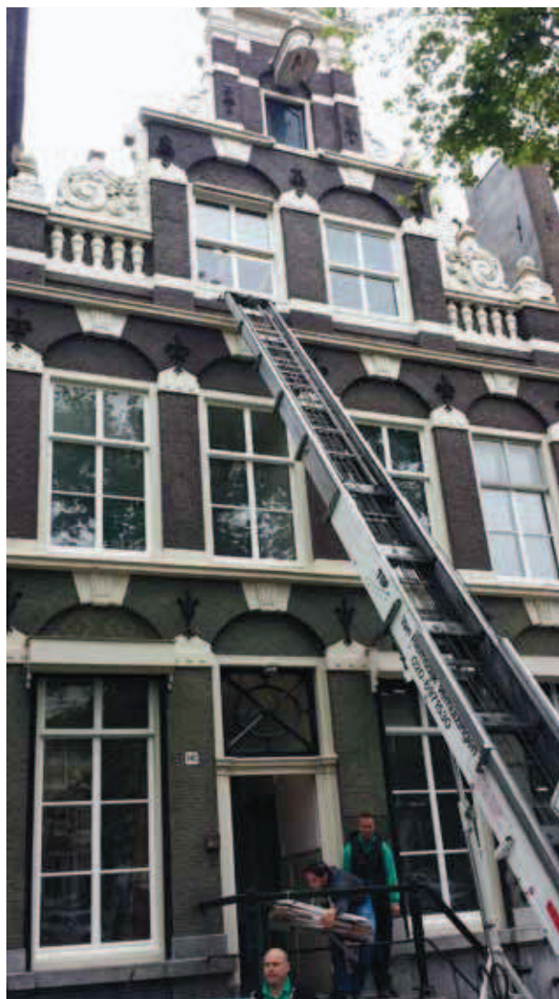
Verhuizing vanuit het Zuid-Afrikahuis aan de Keizersgracht.

Aan het Zuid-Afrikahuis als verzamelpand gaat de geschiedenis van de collectie archieven vooraf. Ten tijde van de Anglo-Boerenoorlogen (1880-1881, 1899-1902) werden in Nederland diverse actiecomités opgericht ter ondersteuning van de Boerenrepublieken Transvaal (de Zuid-Afrikaanse Republiek) en Oranje Vrijstaat. Deze Boerenrepublieken waren in de loop van de negentiende eeuw gesticht door de Afrikaanstalige bevolking in zuidelijk Afrika ten tijde van de zogenaamde 'Grote Trek' van de