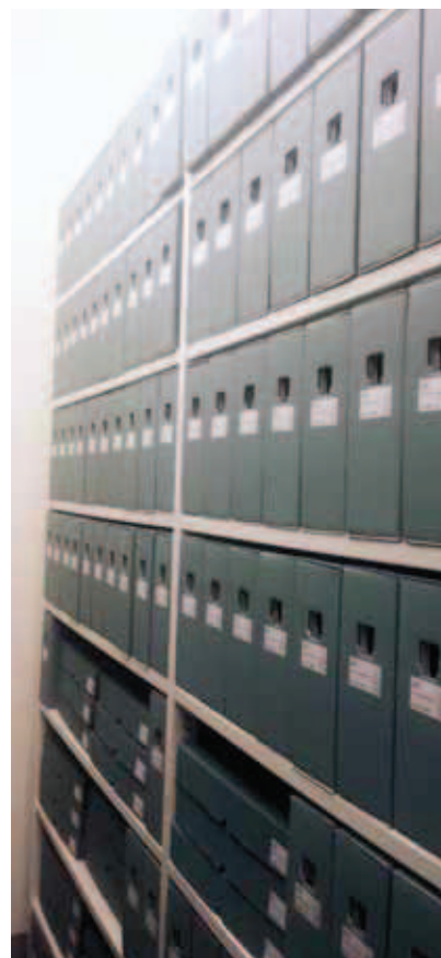
De bewerkte archieven van het Zuid-Afrikahuis in stellingen.

Op 13 februari 2016 viert het Zuid-Afrikahuis de feestelijke heropening van het pand en de bibliotheek. De collectie archieven van het Zuid-Afrikahuis is fysiek en digitaal raadpleegbaar vanaf 16 februari 2016. De bibliotheekcollectie (54.000 titels) is al geruime tijd online raadpleegbaar op de eigen website en bevat monografieën, tijdschriften, artikelen, pamfletten, brochures, prenten, affiches en audiovisueel materiaal over Zuid-Afrikaanse taal- en letterkunde, geschiedenis, kunst, politiek, gedragswetenschappen en (historische) theologie. Voor meer informatie: info@zuidafrikahuis.nl . ■