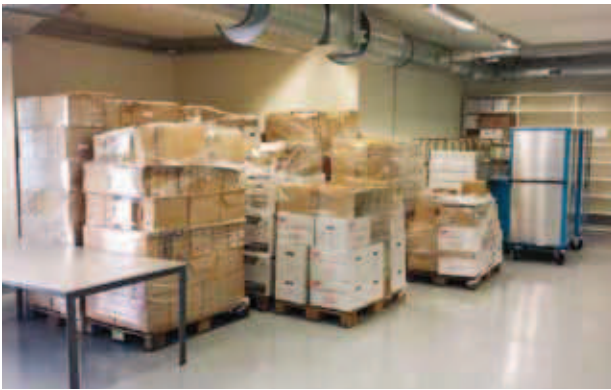
Verhuispallets met archieven, voorafgaand aan bewerking in Alkmaar.